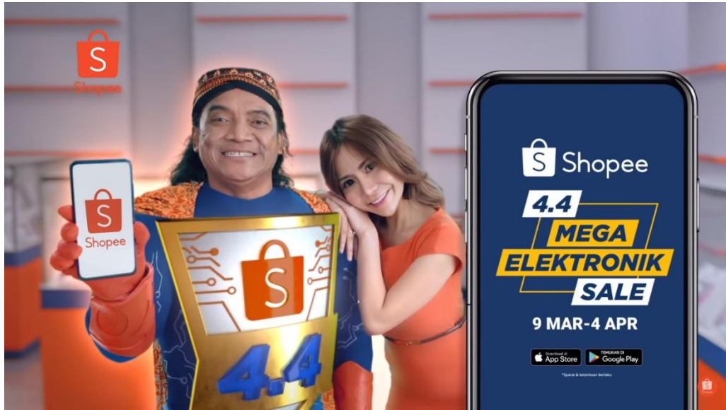
Gambar 2.5 Iklan Shopee 4.4 Mega Eletronik