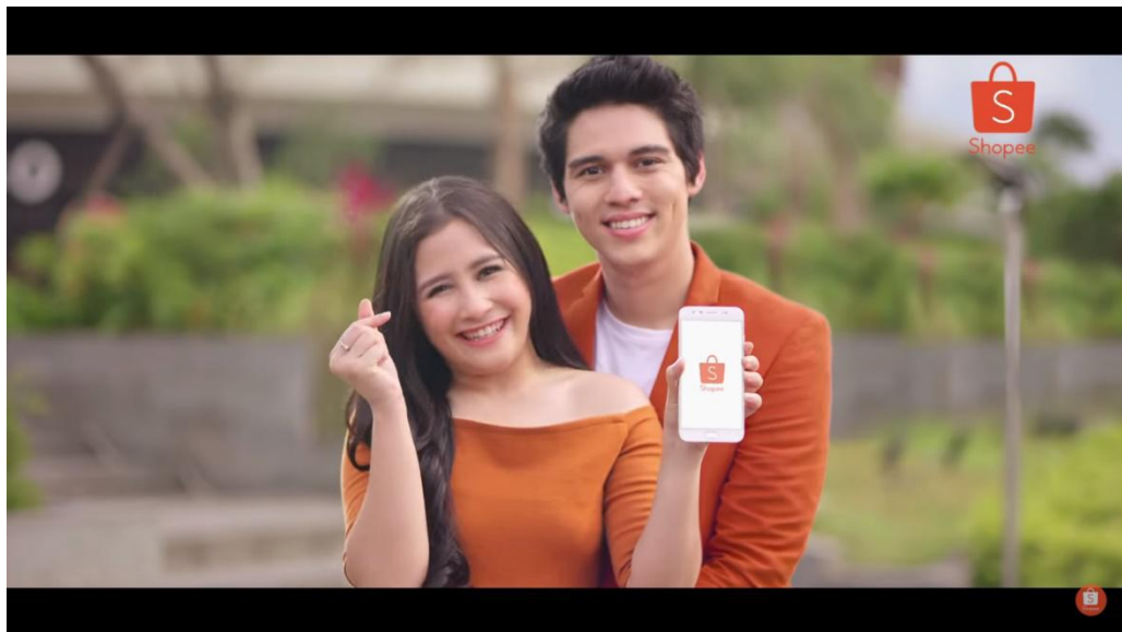
Gambar 2.2 Iklan Shopee Selalu Di Hati