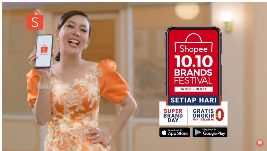
Gambar 2.4 Iklan Shopee 10.10 Brand Festival