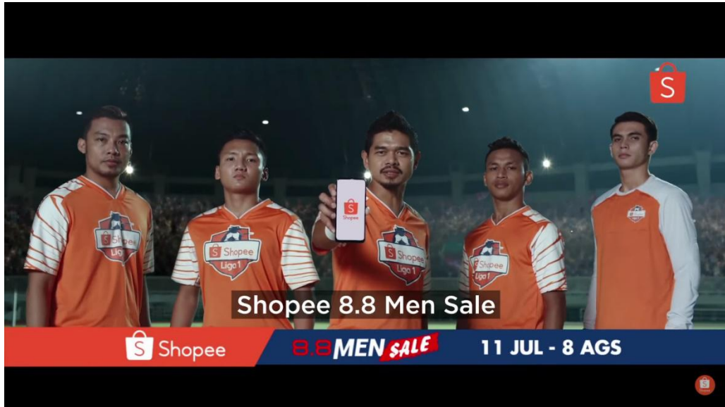
Gambar 2.1 Iklan Shopee 8.8 Men Sale