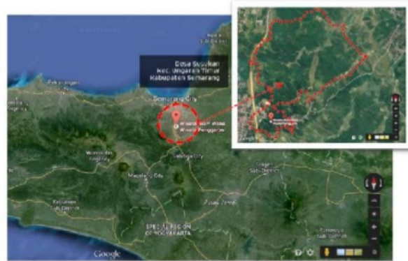
Gambar 1. Peta Hutan Wisata Penggaron Ungaran Jawa Tengah ( https://biroinfrasca.jatengprov.go.id/ )

puspa dan hutan campuran. Metode penelitian yang digunakan adalah metode jelajah (Rugayah et al. , 2004). Pada setiap lokasi dilakukan pencatatan jenis tumbuhan yang bersifat invasif dan dihitung jumlah individu setiap jenisnya. Jenis-jenis yang belum diketahui nama spesiesnya dibawa ke laboratorium untuk dilakukan identifikasi. Dilakukan pengukuran faktor lingkungan yang meliputi: ketinggian tempat, pH tanah, kelembaban udara, suhu udara.