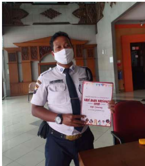
Gambar 2. 7 Penyerahan proposal sponsorship

Setelah membuat target perusahaan yang dituju untuk menjadi pihak sponsor acara, koordinator sponsor membuat proposal pengajuan sponsor dan surat sponsorship bersama dengan sekretaris. Dalam menyebarkan surat dan proposal, koordinator sponsor membuat waktu untuk penyebaran yakni lima hari terhitung dari tanggal 3 Juli 2020 - 7 Juli 2020 dan satu minggu setelahnya untuk follow up mengenai pengajuan surat dan proposal sponsor.