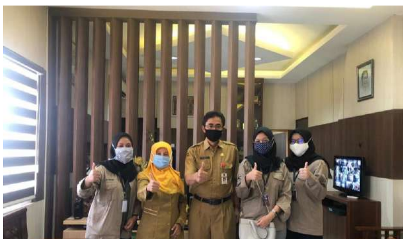
Gambar 2. 4 Pendekatan dengan kepala Dinas Sosial Kota Semarang