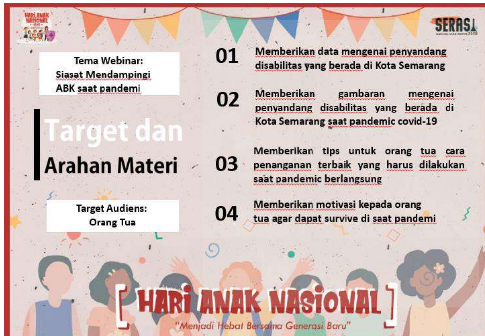
Gambar 2. 22 TOR bapak Muthohar, M.M

TOR Webinar “ Siasat Mendampingi Anak Berkebutuhan Khusus Saat Pandemi” Kamis 13 Agustus 2020 pukul 15.00 – 16.30 WIB