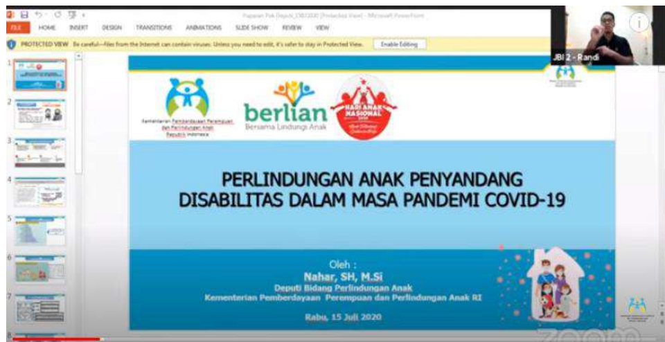
Gambar 2. 12 Referensi webinar Kementerian Pemberdayaan Perempuan dan Anak

Dikarenakan minimnya pengalaman koordinator webinar pada acara webinar pemerintahan, koordinator webinar mencari beberapa referensi webinar di akun youtube Kementerian Pemberdayaan Perempuan dan Perlindungan Anak Republik Indonesia. Pemilihan akun tersebut dipilih karena merupakan rujukan yang sudah ditetapkan oleh pemerintah pusat kepada setiap pemerintah daerah. Walaupun pada teknisnya dapat di improvisasi oleh pemerintah daerah.