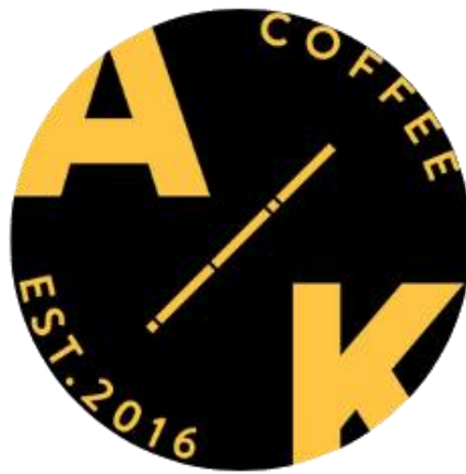
Gambar 2.1 Logo Antara Kata Coffee Talk Banyumanik

(Sumber : Arsip dan Dokumentasi Antara Kata Banyumanik, 2021)