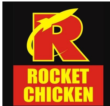
Gambar 2. 1 Logo Rocket Chicken