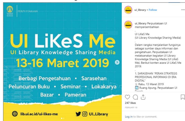
Gambar 4.3 Kegiatan Promosi UI Likes Me .