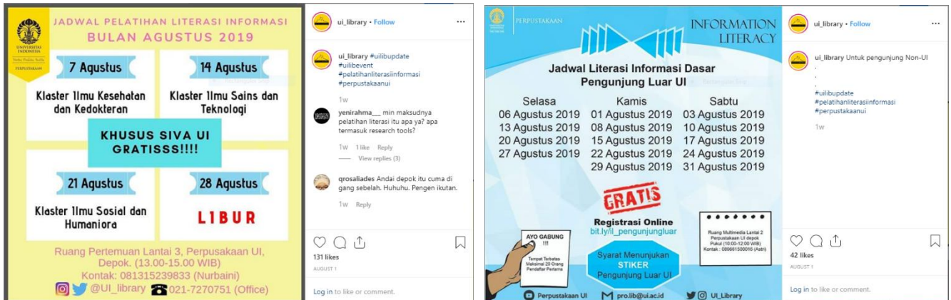
Gambar 4.2 Kegiatan Promosi dengan Pelatihan Literasi Informasi di Perpustakaan Universitas Indonesia.