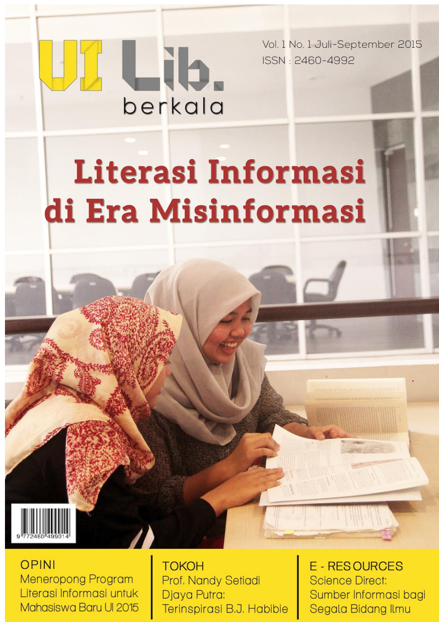
Gambar 4.4 Tampilan Cover Newsletter UI Lib. Berkala Volume 1 Nomor 1 Tahun 2015.