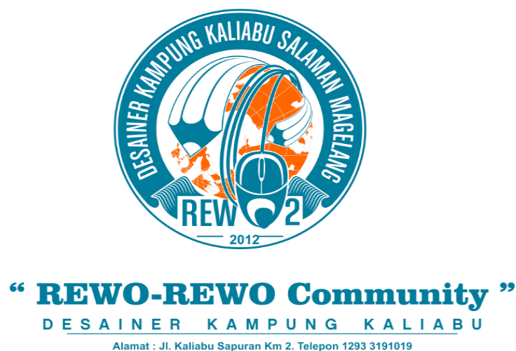
Gambar 4.6: Logo Komunitas Rewo-Rewo

Bar yang merupakan salah satu pelopor pendiri komunitas. Makna-makna filosofis juga disertakan pada setiap komponen-komponen gambar logo tersebut. Gambar bola dunia berwarna jingga di dalam logo yang dikelilingi oleh gambar pensil dan mouse bermakna bahwa produk yang dipasarkan oleh anggota-anggota komunitas merupakan produk yang menglobal atau mencakup seluruh wilayah di dunia. Produk logo hasil dari kegiatan desain grafis tidak hanya dapat dipasarkan secara offline melainkan juga online yang disarankan oleh website-website outsourcing . Dengan kemudahan berkomunikasi secara online , maka kegiatan berbisnis pun tidak lagi dibatasi pada wilayah tertentu saja. Begitu pula dengan para anggota komunitas yang dalam penjualan produk-produk logonya telah mencapai ke wilayah Amerika, India, dan juga beberapa wilayah di Asia.