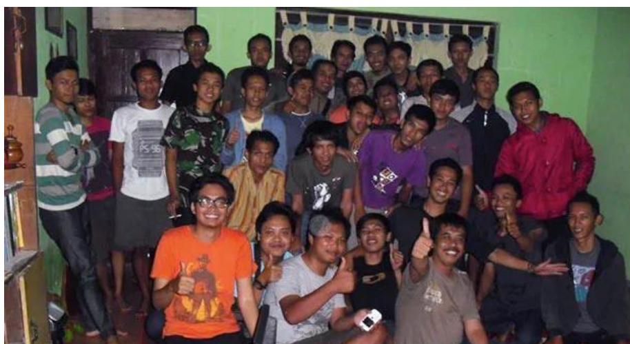
Gambar 4.2: Komunitas Rewo-Rewo