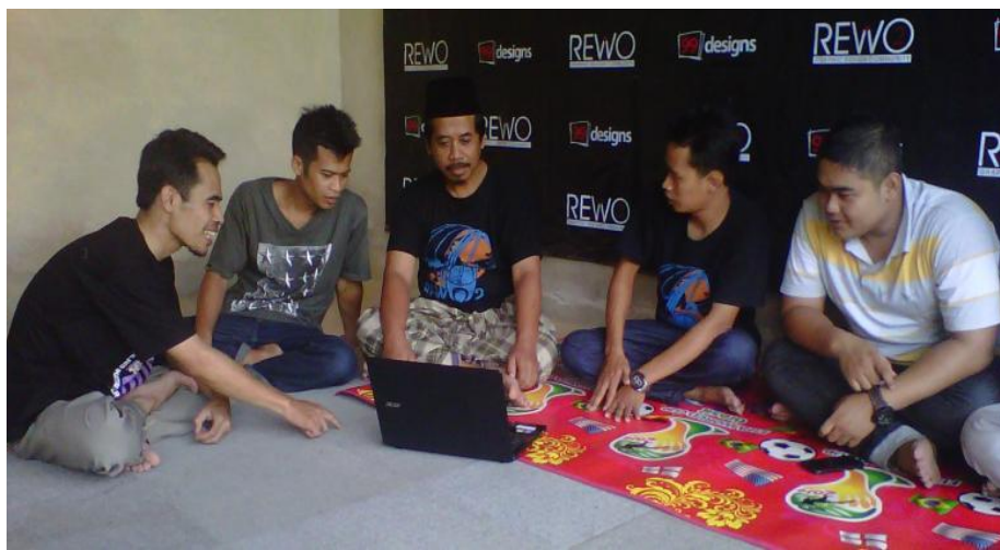
Gambar 4.1: Komunitas Rewo-Rewo

menimbulkan rasa enggan untuk bergabung. Hal tersebut dikarenakan beberapa masyarakat Kaliabu yang menjadi desainer grafis merupakan masyarakat kalangan menengah ke bawah pada mulanya sehingga mudah untuk timbul rasa malu dan rendah diri apabila dirasakan komunitas itu terlalu eksklusif dalam pemilihan namanya.