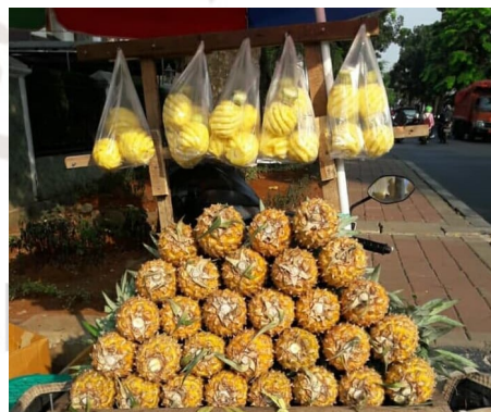
Gambar 2.3. Nanas Madu

Nanas berasal dari Brasilia (Amerika Selatan). Nanas masuk ke Indonesia pada abad ke-15, (1599). Tumbuhan nanas termasuk tumbuhan kering yang menyimpan air. Ananas Comosus L termasuk tumbuhan (CAM) Crassulacean Acid Metabolism . Terdapat dua kelompok utama berdasarkan duri daun, yaitu berduri dan tidak berduri. Nanas yang daunnya tidak berduri termasuk varietas Cayenne . Sedangkan Queen dan Spanish mewakili kelompok nanas dengan daun berduri. Tanaman nanas madu merupakan salah satu tanaman buah-buahan yang memiliki prospek penting di Indonesia. Hal ini disebabkan nanas madu memiliki rasa yang lebih manis dibandingkan dengan nanas biasa, sehingga nanas madu banyak dikonsumsi oleh masyarakat. Nanas madu memiliki kandungan air dan gula.