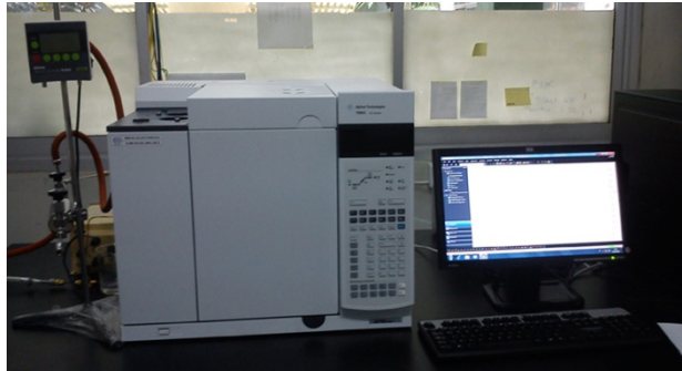
Gambar 2.2. Alat test kromatografi gas