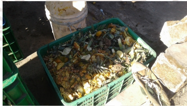
Gambar 2.4. Limbah kulit nanas

Limbah nanas berupa kulit, ati/bonggol buah, atau cairan buah/gula dapat diolah menjadi produk lain seperti sari buah atau sirup. Secara ekonomi kulit nanas masih bermanfaat untuk diolah menjadi pupuk dan pakan ternak.