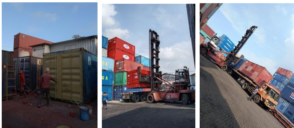
Gambar 1. 3 Kondisi Lingkungan Kerja PT Sariadi Wahana Jasa

Berdasarkan hasil pengamatan penulis, PT Sariadi Wahana Jasa terus menghadapi beberapa tantangan administratif dan operasional yang menghambat efektivitas pengelolaan kontainer. Pengamatan awal menunjukkan bahwa perusahaan beroperasi dengan jumlah kontainer yang terbatas, sehingga sulit mengakomodasi volume kargo yang tinggi. Gaji karyawan dianggap tidak memadai dibandingkan dengan beban kerja dan tanggung jawab mereka, yang mempengaruhi motivasi dan kinerja. Sebagian besar kontainer diklasifikasikan sebagai kelas B, sehingga memerlukan kerja sama dengan pihak eksternal untuk memenuhi standar kelas A. Selain itu, perusahaan menghadapi kekurangan peralatan berat, dengan banyak unit yang ada sering rusak, menyebabkan penundaan dalam aktivitas muat dan bongkar.