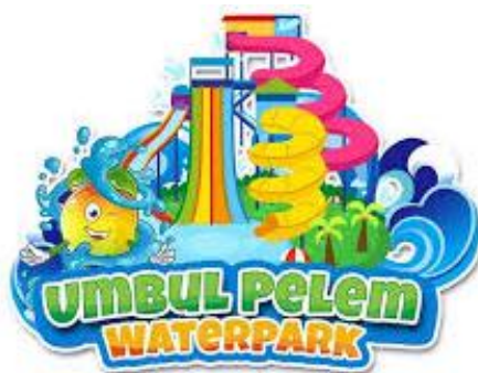
Gambar 2.1 Logo Umbul Pelem Klaten

Berikut ini merupakan logo dari Desa Wisata Umbul Pelem Klaten :