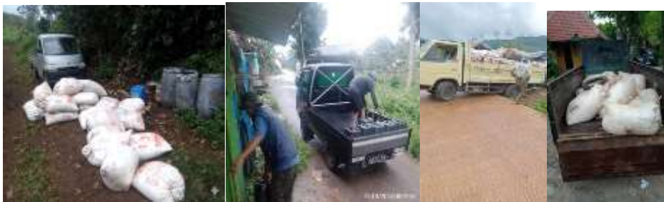
Gambar 4. 9 Proses Distribusi & Pengangkutan Hasil Sadapan Getah Pinus

Pernyataan tersebut menunjukkan bahwa proses distribusi getah pinus tidak dilakukan secara langsung dari lokasi sadap menuju pabrik pengolahan, melainkan melalui beberapa tahapan pengumpulan terlebih dahulu. Sistem distribusi tersebut diterapkan karena sebagian besar lokasi penyadapan berada di dalam kawasan hutan yang memiliki akses transportasi terbatas dan kondisi medan yang cukup sulit dijangkau kendaraan operasional.