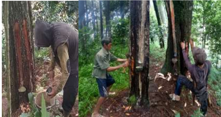
Gambar 4. 6 Aktivitas Penyadapan Getah Pinus

Gambar 4.6 menunjukkan aktivitas penyadapan getah pinus yang dilakukan pada kawasan hutan produksi BKPH Banjarn. Berdasarkan hasil observasi, kegiatan penyadapan masih dilakukan secara manual menggunakan alat sadap yang telah disediakan oleh perusahaan. Proses penyadapan diawali dengan pembuatan pelukaan pada batang pohon pinus menggunakan alat sadap (kadukul), kemudian pada bidang sadap diberikan bahan perangsang getah (sosepas) untuk membantu memperlancar keluarnya getah. Getah yang keluar selanjutnya ditampung menggunakan batok yang dipasang pada batang pohon sebelum dipanen dan dikumpulkan ke tempat pengumpulan getah.