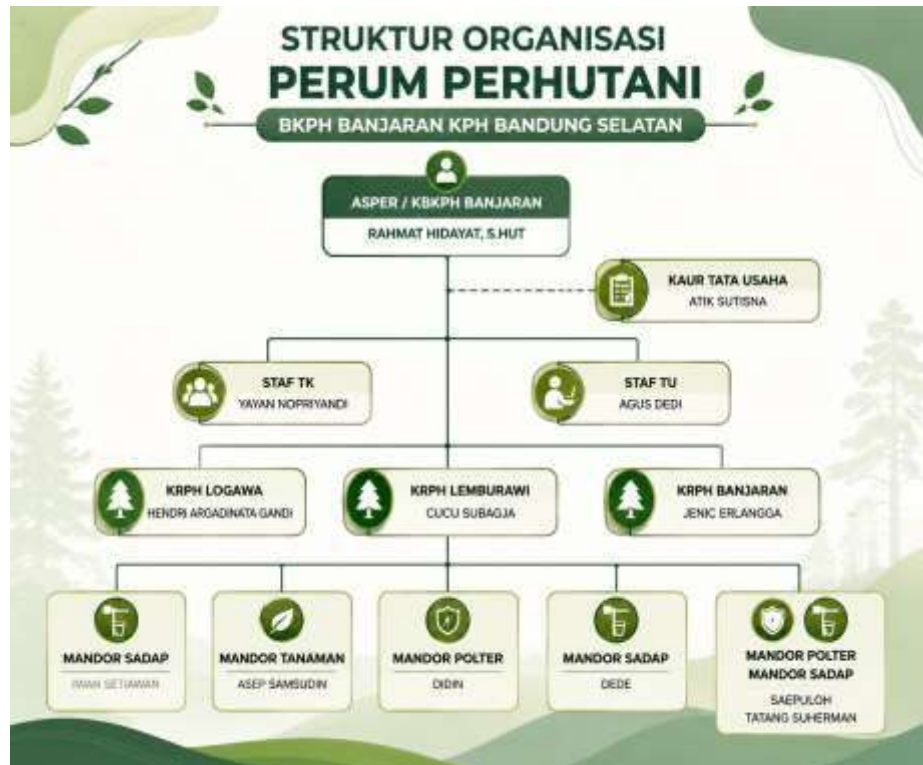
Gambar 4. 3 Struktur Organisasi BKPH Banjaran