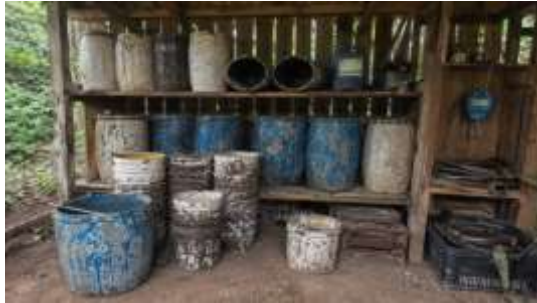
Gambar 4. 8 Alat dan Wadah sadap Getah Pinus

Gambar 4.8 menunjukkan berbagai alat dan wadah yang digunakan dalam kegiatan penyadapan getah pinus di BKPH Banjaran. Peralatan tersebut terdiri atas kadukul yang digunakan untuk membuat atau memperbaiki luka sadap pada batang pinus, sosepas sebagai wadah penampung getah yang keluar dari batang pohon, ember untuk mengumpulkan hasil sadapan dari setiap pohon, serta drum dan wadah penyimpanan yang digunakan dalam proses penampungan sementara sebelum getah dikirim ke tempat pengolahan. Selain itu, terlihat pula timbangan yang digunakan untuk menimbang hasil getah pinus yang telah terkumpul sebelum dicatat dan diserahkan kepada pihak pengelola.