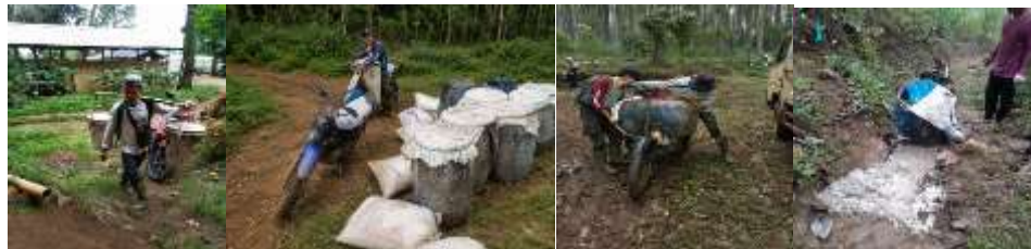
Gambar 4. 10 Pengangkutan Getah Pinus secara Manual

Namun, tidak seluruh lokasi sadap dapat dijangkau secara langsung oleh kendaraan operasional. Pada beberapa petak sadap yang berada jauh dari akses jalan, hasil sadapan masih harus diangkut secara manual oleh penyadap. Kondisi tersebut dapat dilihat pada Gambar 4.6 yang menunjukkan kegiatan pengangkutan getah pinus dari lokasi penyadapan menuju titik pengumpulan terdekat.