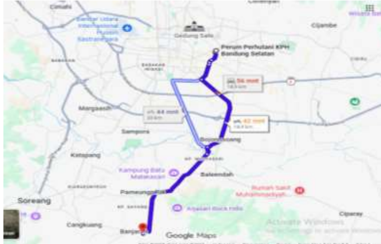
Gambar 4. 2 Lokasi Perusahaan

Perum Perhutani KPH Bandung Selatan merupakan salah satu unit pengelolaan hutan yang berada di wilayah Jawa Barat dan membawahi beberapa Bagian Kesatuan Pemangkuan Hutan (BKPH), salah satunya BKPH Banjaran. Penelitian ini dilaksanakan di BKPH Banjaran yang berlokasi di Kecamatan Banjaran, Kabupaten Bandung, Jawa Barat, 40377. Kawasan ini didominasi oleh hutan pinus sehingga kegiatan operasional utamanya meliputi penyadapan, pengumpulan, dan distribusi getah pinus.