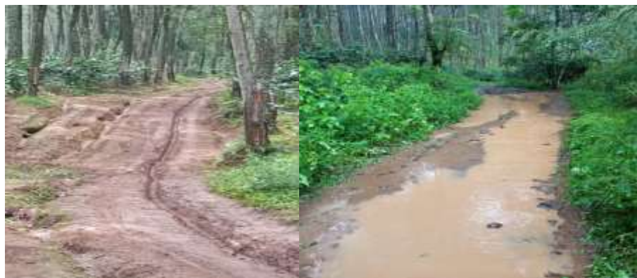
Gambar 4.5 Kawasan Hutan Produksi BKPH Banjaran

Selanjutnya ada Kegiatan produksi getah pinus di BKPH Banjaran dilaksanakan pada kawasan hutan produksi yang sebagian besar memiliki kondisi topografi berbukit dengan akses jalan yang masih didominasi jalan tanah dan berbatu. Berdasarkan hasil observasi lapangan, kondisi tersebut memengaruhi aktivitas penyadapan maupun pengangkutan hasil sadapan, terutama saat musim hujan. Jalan yang licin dan berlumpur menyebabkan mobilitas tenaga kerja serta kendaraan operasional menjadi lebih terbatas dibandingkan kondisi normal..