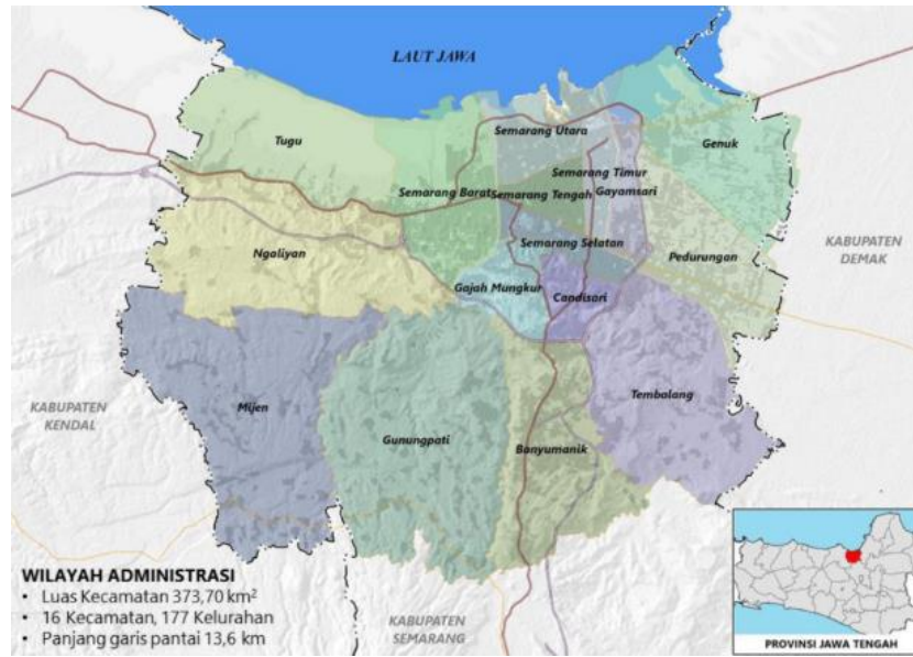
Gambar 2. 1 Peta Kota Semarang