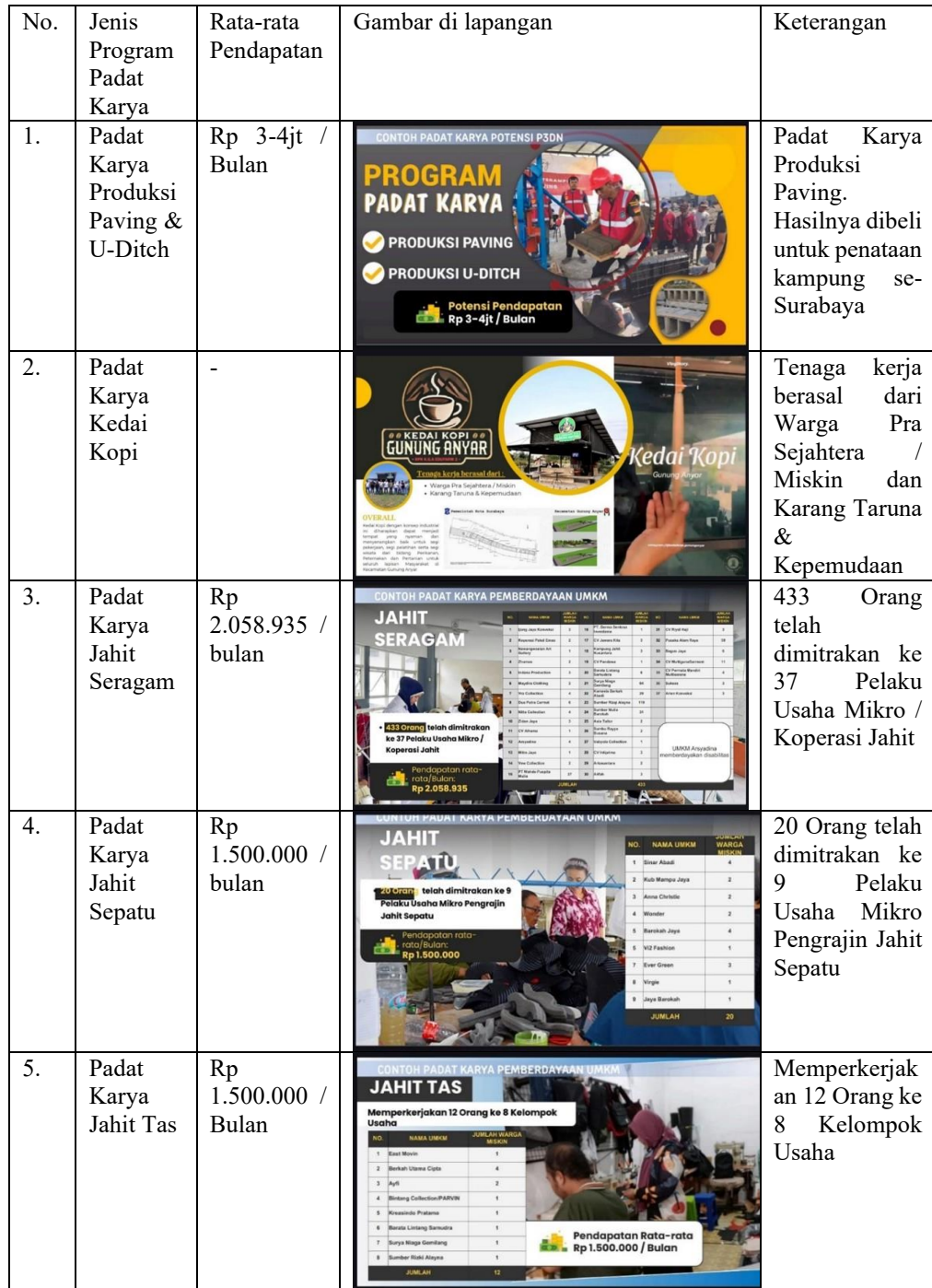
Tabel 2. 13 Beberapa Contoh Nyata Program Padat Karya yang Telah Berjalan