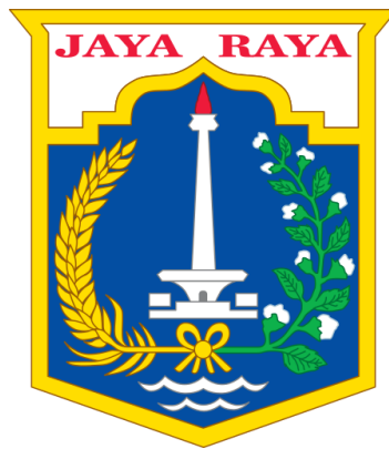
Gambar 2. 2 Logo Provinsi DKI Jakarta

Provinsi DKI Jakarta melalui Peraturan Pemerintah Pengganti Undang-Undang Nomor 2 Tahun 1961 menetapkan satu logo sebagai representasi identitas dan jati diri daerah. Melalui logo ini, diangkat nilai keterbukaan, kemajuan, kemakmuran, kesejahteraan, dinamis, serta keberanian di Provinsi DKI Jakarta.