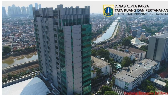
Gambar 2. 5 Gedung Kantor Dinas Cipta Karya, Tata Ruang, dan Pertanahan Provinsi DKI Jakarta

sebagaimana diatur dalam Undang-Undang Nomor 26 Tahun 2007 tentang Penataan Ruang.