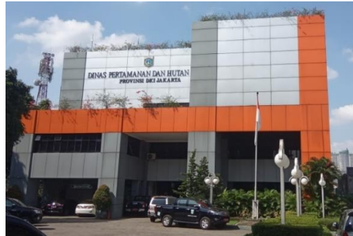
Gambar 2. 3 Gedung Kantor Dinas Pertamanan dan Hutan Kota Provinsi DKI Jakarta

Kota bertanggung jawab atas pengelolaan pertamanan, hutan kota, dan ruang terbuka hijau di wilayah DKI Jakarta, serta memperoleh mandat untuk menjalankan fungsi pelestarian lingkungan dan penataan ruang hijau di Provinsi DKI Jakarta.