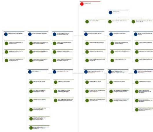
Gambar 2. 6 Struktur Organisasi Dinas Cipta Karya, Tata Ruang, dan Pertanahan Provinsi DKI Jakarta