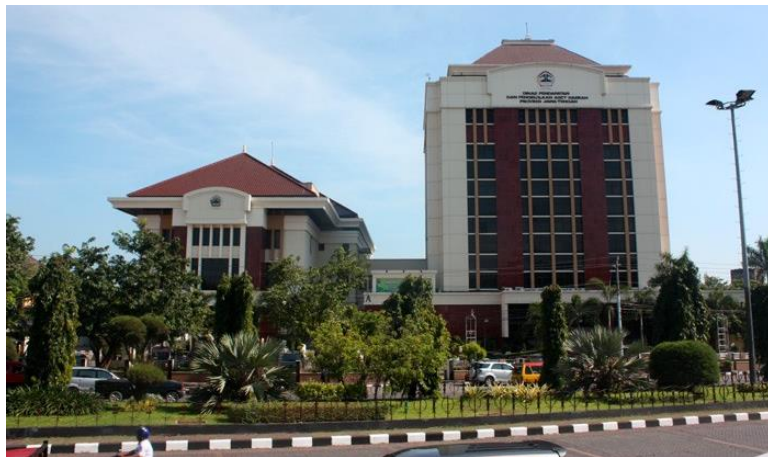
Gambar 3.1 Terkait Lokasi Badan Pengelola Pendapatan Daerah (Bapenda) Provinsi Jawa Tengah

Pemerintah Daerah Kabupaten/Kota, Peraturan Pemerintah Nomor 41 Tahun 2007 tentang Organisasi Perangkat Daerah, serta Peraturan Menteri Dalam Negeri Nomor 57 Tahun 2007 tentang Petunjuk Teknis Penataan Organisasi Perangkat Daerah.