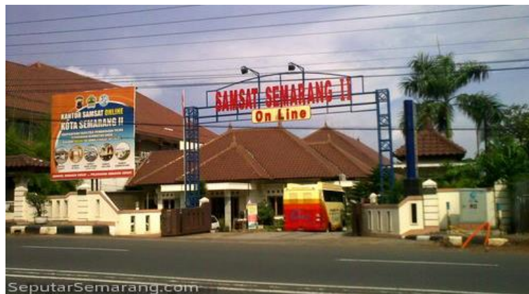
Gambar 3.2 Terkait Lokasi Penelitian Samsat Semarang 2 Setiabudi Semarang

Dalam menjalankan tugasnya, Samsat Semarang II bekerja sama dengan Kepolisian Negara Republik Indonesia (Polri) dan PT Jasa Raharja untuk memberikan pelayanan yang terintegrasi kepada masyarakat. Pemilihan Samsat Semarang II sebagai lokasi studi penelitian didasarkan pada fungsinya sebagai salah satu unit pelaksana pelayanan Pajak Kendaraan Bermotor di Kota Semarang yang berada di bawah kebijakan Bapenda Provinsi Jawa Tengah.