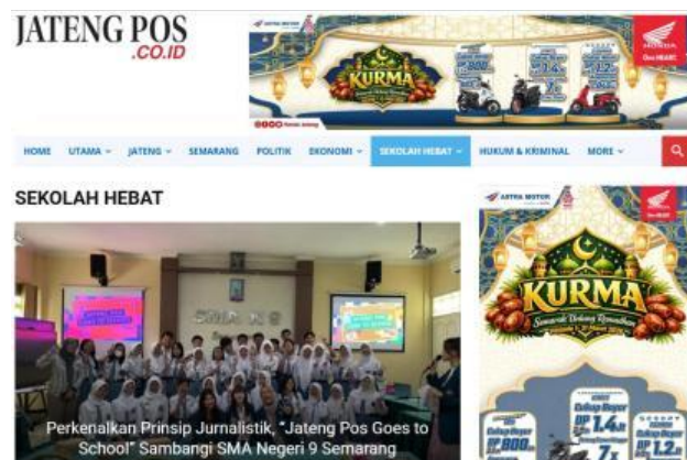
Gambar 2. 3 Tampilan halaman kanal Sekolah Hebat pada website jatengpos.co.id

Pada kanal ini, Jateng Pos membagikan berita mengenai kegiatan yang berlangsung di sebuah instansi pendidikan, yaitu sekolah dan universitas. Disamping itu, berita mengenai penghargaan, prestasi, hingga kolaborasi sekolah dengan suatu instansi, juga dapat dipublikasikan pada kanal Sekolah Hebat. Hadirnya kanal ini bertujuan untuk menjalin kolaborasi, memperkenalkan aktivitas, hingga pencapaian suatu sekolah maupun universitas di Kota Semarang.