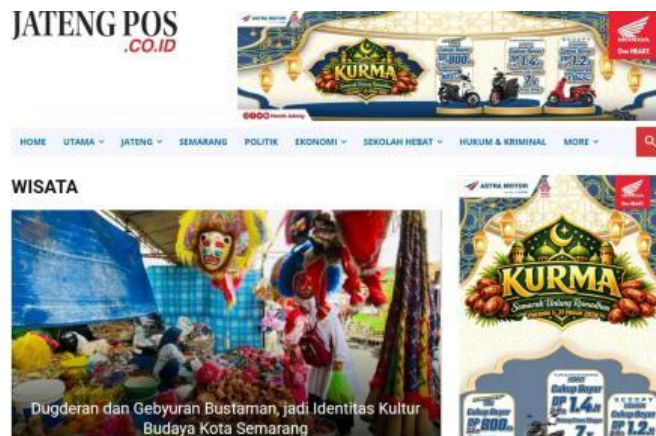
Gambar 2. 5 Tampilan halaman kanal Wisata pada website jatengpos.co.id

Selain menampilkan gambaran dan ulasan mengenai tempat-tempat wisata, kanal ini juga memuat informasi mengenai berbagai agenda pariwisata, festival, dan perayaan budaya yang diselenggarakan di berbagai daerah di Jawa Tengah. Informasi tersebut mencakup kegiatan seperti festival budaya, perayaan tradisional, maupun event pariwisata yang menjadi daya tarik bagi wisatawan dan dapat menjadi referensi bagi masyarakat yang ingin mengunjungi atau mengikuti acara tersebut.