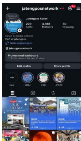
Gambar 2. 2 Profil media sosial Instagram Jateng Pos @jatengposnetwork

Salah satu produk yang ditawarkan Jateng Pos adalah media sosial Instagram. Dengan nama akun @jatengposnetwork, Instagram ini dijadikan sebagai saluran untuk menyebarkan berita online dari website Jateng Pos (jatengpos.co.id) ke audiens media sosial, baik followers maupun non followers . Melalui media sosial Instagram, Jateng Pos membagikan berita berdasarkan kanal yang tersedia di website menggunakan template desain sesuai dengan ketentuan yang telah ditetapkan di design guideline . Berita yang diunggah melalui media sosial Instagram merupakan berita yang sudah ditentukan terlebih dahulu kemudian disajikan dalam bentuk feeds carousel ataupun video reels yang dibagikan melalui media sosial Instagram Jateng Pos (@jatengposnetwork). Disamping itu, akun @jatengposnetwork juga dimanfaatkan sebagai sarana promosi kegiatan yang diselenggarakan oleh Jateng Pos, hingga brand yang sedang bekerja sama dengan Jateng Pos.