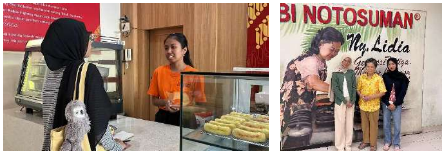
Gambar 4. 1 Pelaksanaan observasi dan wawancara

Setelah melakukan studi literatur, peneliti mulai menyusun daftar rekomendasi tempat penjualan kue serabi khas Surakarta lengkap dengan informasi jam operasional, menu dan harga pada tempat-tempat tersebut. Setelah daftar tersusun, peneliti kemudian mendatangi langsung lokasi-lokasi tersebut untuk melakukan observasi. Berdasarkan hasil studi literatur, rekomendasi tempat penjualan kue serabi khas Surakarta yang digemari masyarakat diantaranya adalah: Serabi Notosuman Ny.Lidia, Serabi Notosuman Ny. Handayani, dan Serabi Linco. Peneliti mendatangi ketiga lokasi tersebut untuk melakukan observasi mendalam serta wawancara untuk dijadikan sebagai sumber informasi booklet . Melalui kegiatan ini, dapat membantu peneliti dalam memahami latar belakang kue serabi khas Surakarta.