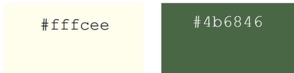
Gambar 4. 4 Palet warna booklet