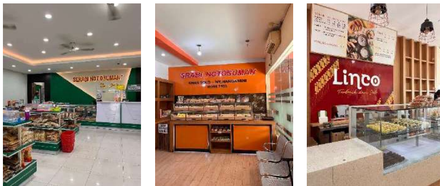
Gambar 4. 2 Pelaksanaan dokumentasi

Selama proses observasi, peneliti juga melakukan dokumentasi dengan pengambilan foto dan video mulai dari kondisi tempat penjualan kue serabi hingga proses pembuatan kue serabi. Selain itu, peneliti juga melakukan dokumentasi berupa video wawancara dengan narasumber guna memastikan informasi yang didapatkan sudah akurat dan lengkap, sehingga isi booklet dapat disusun sesuai fakta yang ada. Sebelum melakukan dokumentasi, peneliti sudah terlebih dahulu menghubungi ketiga pihak tempat penjualan kue serabi guna meminta izin untuk melakukan observasi dan dokumentasi disertai dengan surat izin pengambilan data dari universitas. Setelah mendapatkan izin, peneliti langsung melakukan dokumentasi pada ketiga tempat penjualan sebagai data pendukung dan hasil dari dokumentasi tersebut dijadikan sebagai elemen tambahan pada booklet untuk mendukung visualisasi booklet .