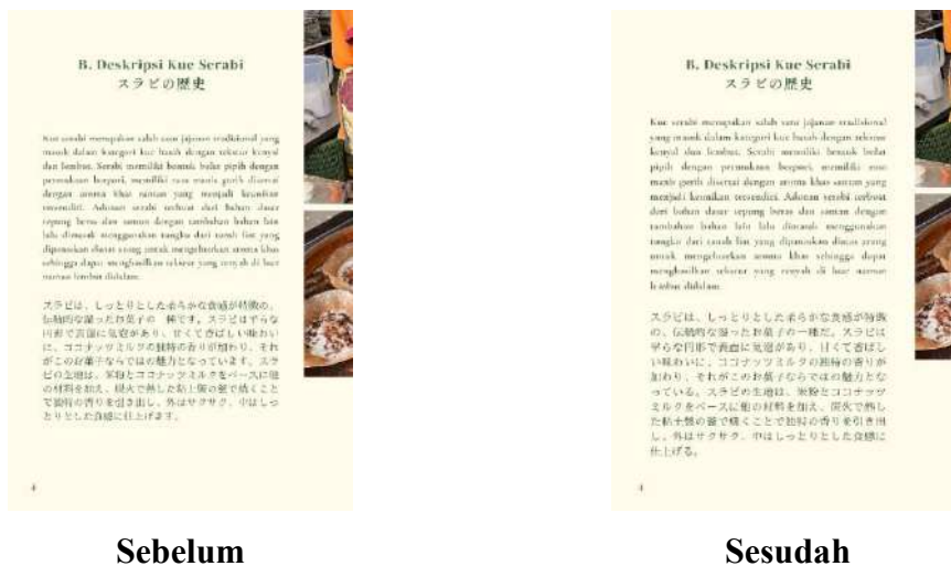
Gambar 4. 7 Revisi produk utama 1

Berdasarkan gambar diatas merupakan hasil dari perubahan revisi ke bentuk futsukei . Validator memberikan saran kepada peneliti untuk mengubah kalimat ke bentuk futsukei pada keseluruhan booklet , gambar diatas hanyalah salah satu contoh perbaikan. Adapun bentuk yang diubah adalah pada kalimat お菓子の一種です diubah menjadi お菓子の一種だ, lalu pada kalimat なっています diubah menjadi なっている, lalu pada kalimat 仕上げます diubah menjadi 仕上げる. Perubahan