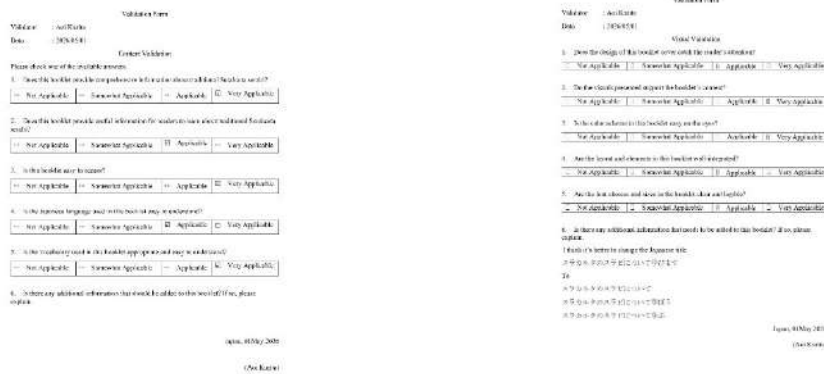
Gambar 4. 6 Hasil validasi mahasiswa penutur asli bahasa Jepang aspek konten dan visual