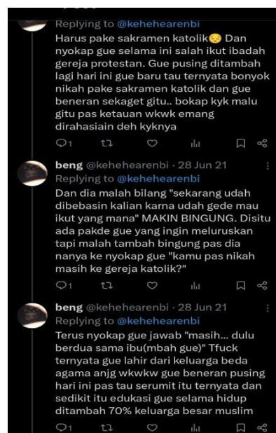
Gambar 1. 6 Pengalaman Anak dari Orang Tua Beda Agama)

Pengalaman lain yang juga dialami oleh pengguna media sosial X dengan nama akun @twittataa. Pemilik akun dalam cuitannya mengatakan bahwa orang-orang yang mengeluhkan tentang bagaimana agama merupakan warisan dari orang tua sehingga anak tidak bisa memilih. Pemilik akun menuliskan dalam postingannya dan menyatakan orang-orang yang mengeluhkan tentang agama warisan harusnya mengetahui bagaimana kesulitan anak yang dibesarkan dengan orang tua beda agama yang dimana keduanya tidak mengajarkan ajaran agama apapun secara mendalam dan bukan agama murni, sehingga anak kesulitan untuk memilih agama karena kebingungan dengan nilai-nilai yang diajarkan atau ditanamkan dari kecil ia juga merasa tidak memiliki cukup informasi atau kedekatan dengan agama sehingga bingung untuk menentukan identitas agamanya, dan pada akhirnya harus menghadapi berbagai konflik dalam penentuan agamanya.