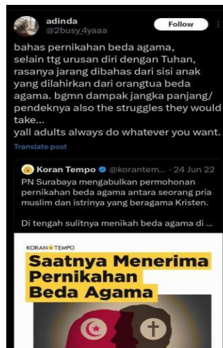
Gambar 1. 4 Pengalaman Anak dari Orang Tua Beda Agama

Pengalaman tumbuh dalam keluarga beda agama juga dikeluhkan oleh anak-anak dari pasangan beda agama pada platform media sosial X. Pemilik akun @2busy_4yaaa membagikan pengalaman pribadinya melalui cuitannya. Pemilik akun menyatakan bahwa pernikahan beda agama memang isu yang mengaitkan diri seseorang itu sendiri dengan Tuhan, tetapi jarang dibahas bagaimana anak-anak dari orang tua yang menikah beda agama mengalami kesulitan dalam menentukan agamanya nanti.