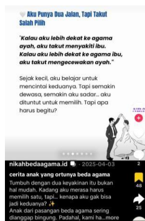
Gambar 1. 3 Pengalaman Anak dari Orang Tua Beda Agama

Pengalaman lain tentang ketidakpastian tersebut juga dirasakan oleh akun TikTok @bbyzzukkyun (abby.bliss) melalui komentar pada akun TikTok @cia.hartono. Pemilik akun mengaku hilang arah karena memiliki orang tua yang awalnya berbeda agama, meskipun sang Ibu sudah berpindah agama tetapi masih menjalankan agama eklektik atau penggabungan doktrin. Hal tersebut menyebabkan pemilik akun mengalami hilang arah karena mendapatkan paparan ajaran agama yang lebih dari satu membuatnya menyadari bahwa semua agama itu baik tetapi tidak benar benar dapat memutuskan agama apa yang akan dianutnya.