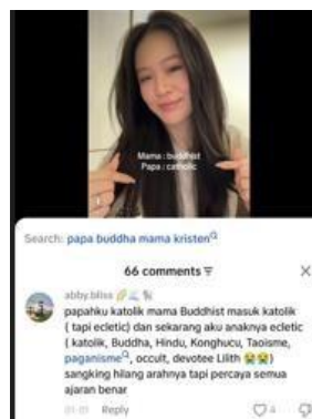
Gambar 1. 2 Pengalaman Anak dari Orang Tua Beda Agama

Seperti pengalaman yang diceritakan oleh akun media sosial TikTok @meicinggg. Pemilik akun merupakan anak dari pasangan orang tua beda agama dan merasakan adanya dua praktik keagamaan dalam kehidupannya. Pemilik akun secara eksplisit mengatakan bahwa sebagai anak dari pasangan beda agama merasakan beberapa kesulitan dalam hidup termasuk pencarian jati diri yang berkaitan dengan agamanya.