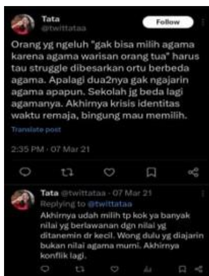
Gambar 1. 5 Pengalaman Anak dari Orang Tua Beda Agama

Pengalaman tumbuh dalam keluarga beda agama juga dikeluhkan oleh anak-anak dari pasangan beda agama pada platform media sosial X. Pemilik akun @2busy_4yaaa membagikan pengalaman pribadinya melalui cuitannya. Pemilik akun menyatakan bahwa pernikahan beda agama memang isu yang mengaitkan diri seseorang itu sendiri dengan Tuhan, tetapi jarang dibahas bagaimana anak-anak dari orang tua yang menikah beda agama mengalami kesulitan dalam menentukan agamanya nanti.