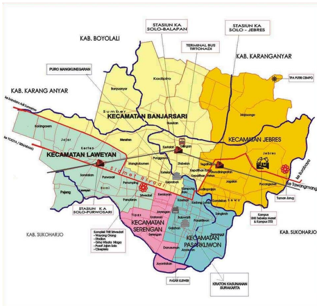
Gambar 2. 1 Peta Geografis Kota Surakarta