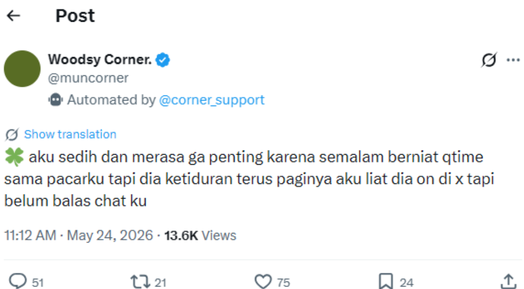
Gambar 2.3 Confession mengenai konflik yang muncul karena aktivitas di media sosial dalam hubungan romantis pengguna cyber account yang diunggah secara anonim melalui autobase @muncorner, base Twitter khusus akun cyber. (Dokumentasi peneliti dari Twitter/X, 2026)

Selain itu, aktivitas digital pasangan dalam hubungan ini sering kali memiliki makna emosional tertentu. Perubahan kecil dalam pola komunikasi, intensitas interaksi, maupun aktivitas di media sosial dapat memengaruhi persepsi individu terhadap hubungan, termasuk munculnya rasa aman maupun ketidakpastian. Fenomena konflik dalam hubungan ini juga sering muncul dalam ruang publik seperti confession base , salah satunya melalui autobase @muncorner di Twitter.