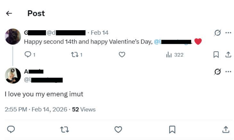
Gambar 2.2 Bentuk interaksi romantis yang ditampilkan melalui postingan dan balasan di timeline Twitter sebagai wujud kedekatan emosional pengguna cyber account. (Dokumentasi peneliti dari Twitter/X, 2026.)

Dalam hubungan romantis berbasis cyber account, kedekatan emosional dibangun melalui komunikasi intensif yang terjadi secara berulang dalam aktivitas sehari-hari di media sosial. Interaksi seperti membalas unggahan, mengirim pesan pribadi, berbagi konten, hingga kehadiran konsisten di ruang digital menjadi bagian dari pembentukan relasi emosional.