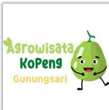
Gambar 2. 1 Logo Agrowisata Kopeng Gunungsari

Logo merupakan elemen grafis yang dapat berupa simbol, tulisan, maupun kombinasi keduanya yang bertujuan untuk merepresentasikan identitas suatu entitas (Rustan, 2009). Berikut ini merupakan logo dari Agrowisata Kopeng Gunungsari: