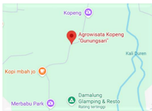
Gambar 2. 3 Peta Lokasi Agrowisata Kopeng Gunungsari

Agrowisata Kopeng Gunungsari berlokasi di Jalan Umbul Songo, Kopeng, Kecamatan Getasan, Kabupaten Semarang, Jawa Tengah. Lokasi ini berada di kawasan pegunungan pada lereng Gunung Merbabu dengan kondisi geografis dataran tinggi yang memiliki iklim sejuk dan lingkungan alam yang asri. Kondisi tersebut mendukung pengembangan Agrowisata Kopeng Gunungsari sebagai destinasi agrowisata berbasis alam yang mengintegrasikan kegiatan pertanian dan pariwisata.