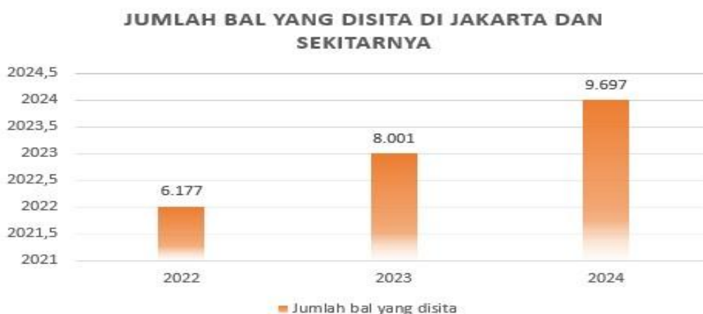
Gambar 1. 2 Grafik jumlah bal yang disita di Jakarta dan sekitarnya tahun 2022-2024.

Sumber: Diolah oleh peneliti (2025) berdasarkan data Direktorat Jenderal Bea dan Cukai, Bareskrim Polri, Liputan6, dan Kompas.com (2022–2024).