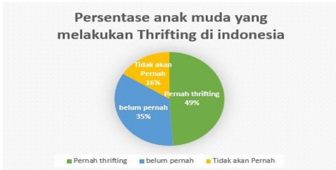
Gambar 1.1 Presentase Anak Muda Melakukan Thrifting Data Survei 2022.