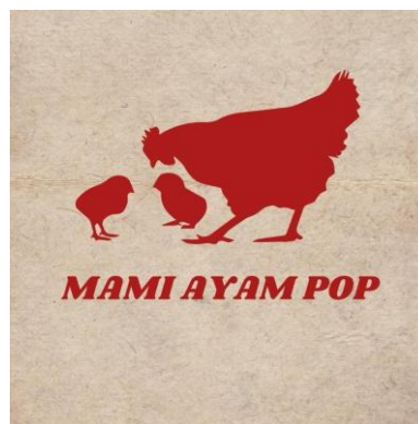
Gambar 2. 2 Logo Mami Ayam Pop

pendekatan tersebut, Mami Ayam Pop tidak hanya menawarkan produk makanan, tetapi juga berusaha membangun kedekatan dengan konsumennya melalui pengalaman makan yang lebih personal dan menyenangkan. Mami Ayam Pop memiliki visi untuk menjadi brand kuliner ayam pop yang dikenal sebagai alternatif masakan tradisional dengan sentuhan modern, serta mampu menjadi bagian dari pilihan kuliner masyarakat, khususnya generasi muda di Kota Semarang.