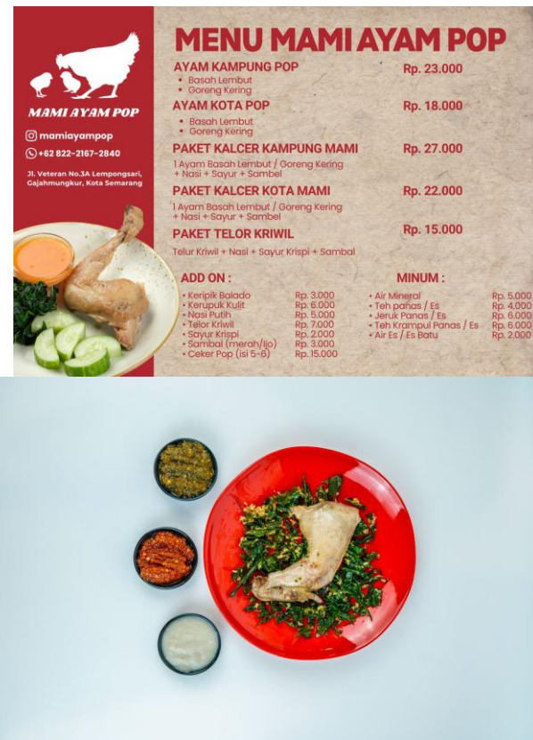
Gambar 2.3 Menu Mami Ayam Pop

Saat ini, Mami Ayam Pop menyediakan dua varian utama, yaitu Ayam Kampung Pop dan Ayam Kota Pop. Kedua varian tersebut tersedia dalam pilihan Ayam Basah Lembut maupun Ayam Goreng Kering. Selain menu utama, tersedia juga paket makanan seperti Paket Kalcer Kampung Mami dan Paket Kalcer Kota Mami yang terdiri dari ayam, nasi, sayur, dan sambal. Kehadiran menu paket ini ditujukan untuk memberikan pilihan konsumsi yang lebih praktis dan terjangkau bagi konsumen, khususnya mahasiswa dan pekerja muda yang menjadi target pasar utama Mami Ayam Pop. Tidak hanya menawarkan menu utama, Mami Ayam Pop juga menyediakan berbagai menu tambahan seperti Telor Kriwil, Ceker Pop, Keripik Balado, Kerupuk Kulit, serta Sayur Krispi yang menjadi salah satu ciri khas brand. Berbeda dengan rumah makan Padang pada umumnya yang menggunakan daun singkong rebus, Mami Ayam Pop menghadirkan sayur crispy sebagai pelengkap makanan untuk memberikan tekstur yang lebih renyah dan modern. Selain itu, tersedia pula dua pilihan sambal, yaitu sambal merah dan sambal ijo, yang dapat disesuaikan dengan tingkat kepedasan sesuai selera