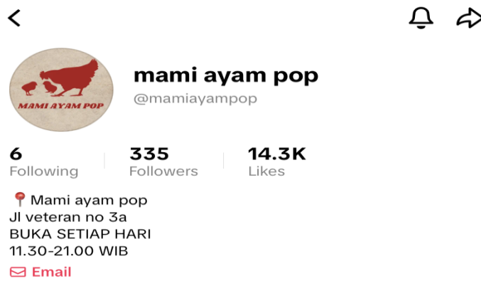
Gambar 2. 5 Akun TikTok Mami Ayam Pop

pemasaran dan meningkatkan brand awareness. Konten yang diunggah berfokus pada promosi program “Vote Your Iftar Flavor” dan “Ramadhan Satnight Tunes”, dikombinasikan dengan konten edukatif mengenai keunikan Ayam Pop, konten interaktif seperti challenge, quiz, dan polling untuk meningkatkan engagement audiens, serta konten promosi yang memperkenalkan menu unggulan dan varian saus spesial Ramadhan. Selain itu, media sosial Mami Ayam Pop juga menampilkan dokumentasi event, live music, serta pengalaman pengunjung untuk membangun kedekatan emosional dengan audiens. Seluruh konten tersebut dirancang tidak hanya sebagai sarana penyampaian informasi dan promosi, tetapi juga sebagai upaya memperkuat positioning Mami Ayam Pop sebagai brand kuliner “Masakan Tradisional Rasa Kekinian” yang modern, interaktif, dan relevan dengan gaya hidup generasi muda.