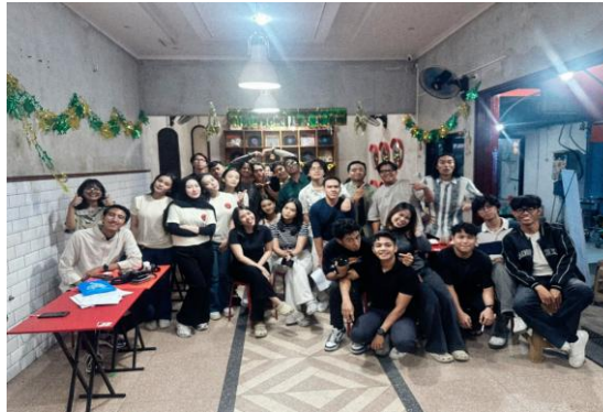
Gambar 2. 4 Event Vote Your Iftar Flavor

yang bertujuan membangun awareness, memperkuat brand positioning, serta menciptakan kedekatan emosional dengan konsumen.