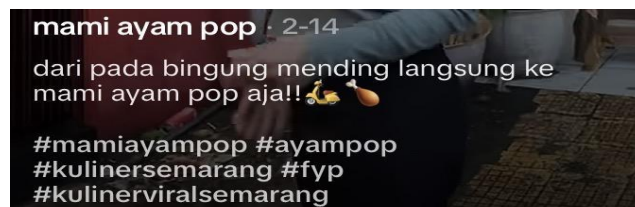
Gambar 2. 8 Akun TikTok Mami Ayam Pop