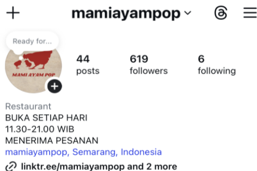
Gambar 2. 6 Akun Instagram Mami Ayam Pop