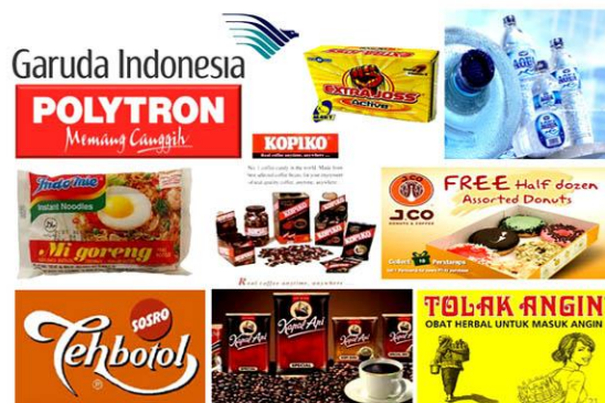
Gambar 2. 6 Ilustrasi

Ilustrasi dan gambar berperan sebagai elemen visual yang membantu memperjelas pesan komunikasi sehingga informasi lebih mudah dipahami oleh audiens. Dalam Public Relations , penggunaan ilustrasi dapat meningkatkan daya tarik pesan sekaligus menciptakan komunikasi yang lebih persuasif dan komunikatif. Visual yang menarik juga mampu membantu membangun citra positif suatu brand di mata konsumen (Spence & Van Doorn, 2022).