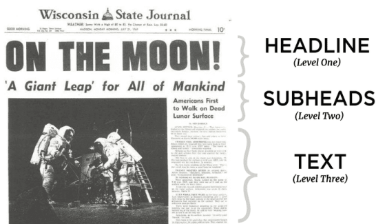
Gambar 2. 5 Tipografi

Tipografi berkaitan dengan penggunaan jenis huruf, ukuran, dan pengaturan teks yang memengaruhi keterbacaan serta karakter visual suatu media komunikasi. Dalam Public Relations , tipografi berfungsi sebagai penyampai informasi sekaligus elemen identitas visual yang mencerminkan karakter brand . Pemilihan jenis huruf yang tepat dapat membantu audiens memahami pesan secara lebih efektif sekaligus meningkatkan estetika desain komunikasi visual (Günay, 2024).