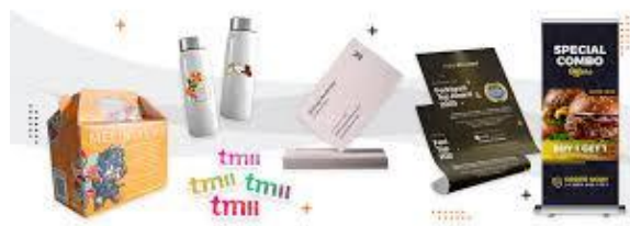
Gambar 2. 2 Contoh Media Konvensional

Dalam praktik Public Relations , media konvensional dimanfaatkan sebagai sarana komunikasi untuk memperkenalkan brand identity sekaligus menyampaikan pesan kepada publik secara visual. Media konvensional mencakup kemasan produk, poster, brosur, banner , dan media cetak lainnya. Kemasan produk menjadi salah satu media komunikasi visual yang berperan penting karena menjadi bagian yang langsung dilihat oleh konsumen saat berinteraksi dengan produk. Selain dipakai untuk melindungi isi produk, kemasan juga dapat membantu menyampaikan informasi, memperkuat karakter visual brand , serta membangun persepsi konsumen terhadap produk yang ditawarkan (Xiao et al., 2022).