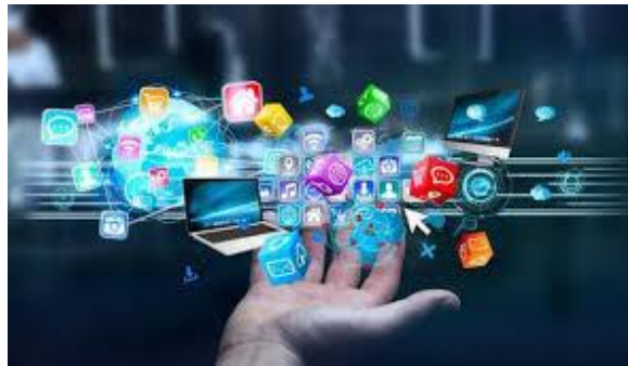
Gambar 2. 3 Contoh Media Digital

sosial, website , serta berbagai platform komunikasi berbasis internet (Xiao et al., 2022). Selain itu, pemanfaatan media digital yang dikombinasikan dengan media konvensional dapat membantu menjaga konsistensi komunikasi brand dalam menyampaikan pesan kepada publik (Xiao et al., 2022).