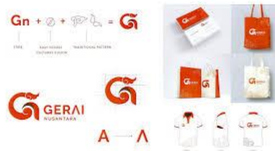
Gambar 2. 1 Contoh Pendukung Brand Identity

Identitas konseptual berkaitan dengan nilai, visi, misi, dan karakter yang menjadi dasar pengembangan suatu brand . Elemen ini membantu menjaga keselarasan antara pesan yang disampaikan dengan citra yang ingin dibangun (Kapferer, 2021).