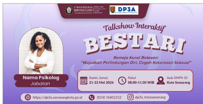
Gambar 4.10 Desain banner awal (Sumber: Dokumentasi penulis)

dilaksanakan. Desain awal, dari segi visual, hanya menyediakan satu ruang untuk foto narasumber. Seiring dengan penyesuaian konsep kegiatan yang melibatkan dua narasumber, desain final kemudian diperbarui dengan menampilkan kedua foto narasumber. Desain final juga dilengkapi dengan ilustrasi siswa laki-laki dan perempuan yang tidak terdapat pada desain sebelumnya. Penambahan elemen visual tersebut dilakukan untuk merepresentasikan sasaran kegiatan, yaitu siswa SMP.