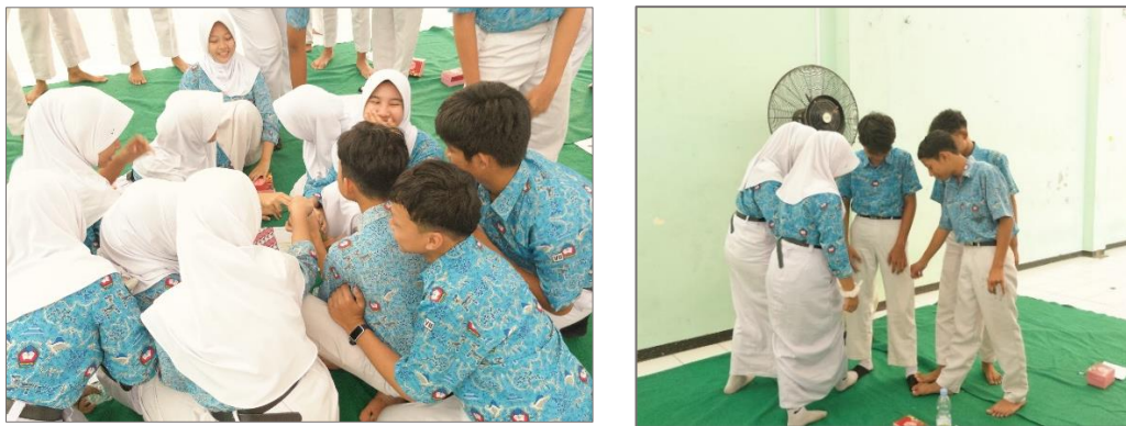
Gambar 4.23 Siswa berkelompok pada sesi ice breaking

adalah untuk menciptakan suasana yang lebih santai sekaligus membantu peserta mengembalikan fokus setelah mengikuti sesi materi dan tanya jawab. Ice breaking yang digunakan adalah permainan “Simon Berkata”, yaitu permainan yang mengharuskan peserta mengikuti instruksi yang diberikan hanya apabila diawali dengan kalimat “Simon berkata”. Sebaliknya, ketika instruksi diberikan tanpa diawali kalimat tersebut, peserta tidak perlu mengikuti arahan yang disampaikan.