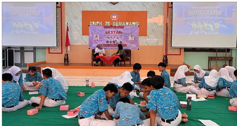
Gambar 4.24 Sesi studi kasus

sebelumnya. Peserta telah dibagi menjadi enam kelompok berdasarkan hasil games sebelumnya, kemudian 2 kelompok dijadikan satu tim, sehingga total terdapat 5 kelompok. Masing-masing kelompok memperoleh satu lembar studi kasus yang telah disiapkan dan dibagikan oleh panitia. Studi kasus yang diberikan memuat berbagai situasi yang berkaitan dengan pelanggaran consent maupun personal boundaries yang kerap mereka jumpai di kehidupan sehari-hari. Setiap studi kasus juga dilengkapi dengan beberapa pertanyaan yang bertujuan untuk mengukur pemahaman peserta mengenai konsep consent , batasan diri, serta bentuk-bentuk kekerasan seksual.