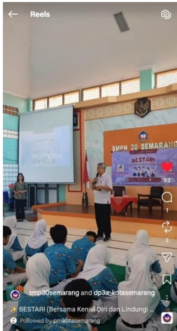
Gambar 4.30 Reels after-event talkshow BESTARI

Selain melalui media sosial, kegiatan talkshow BESTARI juga dipublikasikan melalui portal berita online Jatengku.com pada tanggal 19 Juni 2026 dan Jateng.org pada tanggal 20 Juni 2026. Publikasi pada portal berita online memuat informasi mengenai pelaksanaan kegiatan, tujuan kegiatan, serta rangkaian acara dalam program talkshow BESTARI. Publikasi melalui berita online bertujuan untuk memperluas jangkauan informasi kepada masyarakat, meningkatkan kesadaran masyarakat terhadap isu yang diangkat dalam kegiatan, serta menjadi sarana