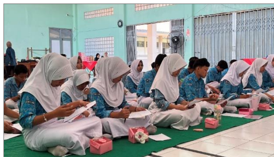
Gambar 4.27 Proses pengerjaan post-test oleh peserta

Kegiatan dilanjutkan dengan pengisian post-test dan kuesioner efektivitas talkshow oleh seluruh peserta. Pada sesi ini, setiap peserta menerima dua lembar instrumen yang terdiri atas lembar post-test dan lembar kuesioner efektivitas kegiatan. Pengisian dilakukan setelah peserta mengikuti seluruh rangkaian kegiatan BESTARI sebagai bagian dari proses evaluasi program. Lembar post-test digunakan untuk mengukur pemahaman peserta mengenai materi consent dan personal boundaries setelah mengikuti kegiatan. Sementara itu, kuesioner evaluasi digunakan untuk memperoleh tanggapan peserta terhadap pelaksanaan setiap sesi kegiatan yang telah diikuti. Pertanyaan dalam kuesioner mencakup penilaian peserta terhadap sesi talkshow , studi kasus kelompok, sesi refleksi, serta aspek pelaksanaan kegiatan secara keseluruhan. Peserta memberikan penilaian