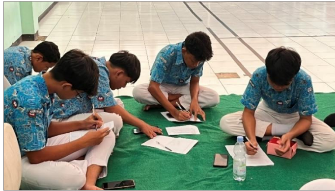
Gambar 4.26 Proses refleksi oleh peserta

yang dimiliki diri sendiri sebagai langkah awal dalam menjaga diri dari berbagai bentuk pelanggaran batasan pribadi.