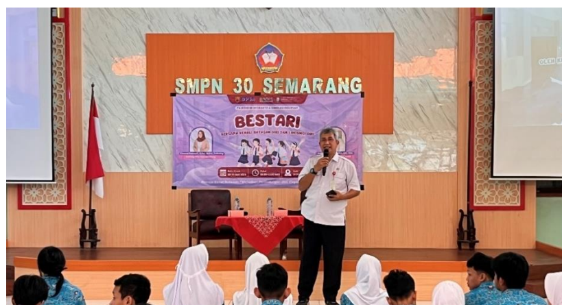
Gambar 4.15 Sambutan oleh Kepala SMP Negeri 30 Semarang

Rangkaian kegiatan Talkshow BESTARI diawali dengan pembukaan acara yang dipandu oleh Master of Ceremony (MC). MC membuka kegiatan dengan menyampaikan salam kepada seluruh peserta, narasumber, panitia, serta tamu undangan yang hadir, antara lain Kepala Sekolah SMP Negeri 30 Semarang, Kepala UPTD PPA DP3A Kota Semarang, Psikolog DP3A Kota Semarang, dan Guru BK selaku pendamping acara. MC kemudian memperkenalkan diri dan memberikan informasi umum mengenai nama kegiatan, tagline , tujuan, dan susunan acara agar peserta memiliki gambaran mengenai pelaksanaan event .