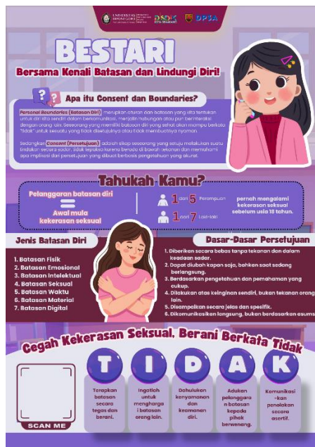
(Desain poster awal)