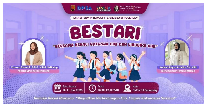
Gambar 4.11 Desain banner final

Setelah melalui beberapa tahap revisi dan penyempurnaan, desain banner kemudian difinalisasi dan dicetak menggunakan bahan flexi dengan ukuran 250 cm × 125 cm. Banner tersebut digunakan sebagai media identitas kegiatan serta dipasang pada lokasi pelaksanaan Talkshow BESTARI untuk mendukung penyampaian informasi dan dokumentasi kegiatan.