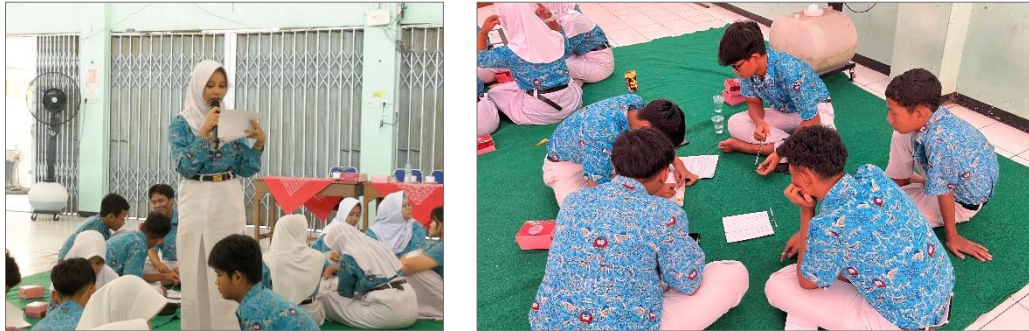
Gambar 4.25 Proses diskusi dan pemaparan hasil diskusi oleh peserta

Setelah presentasi selesai, narasumber memberikan feedback berupa tanggapan, maupun klarifikasi atas jawaban yang disampaikan oleh masing-masing kelompok. Feedback tersebut bertujuan untuk memperkuat pemahaman peserta serta meluruskan apabila terdapat kekeliruan dalam menganalisis kasus yang diberikan. Pelaksanaan studi kasus kelompok menjadi sarana bagi peserta untuk memperdalam pengetahuan yang telah diperoleh selama sesi talkshow ke dalam situasi sehari-hari.