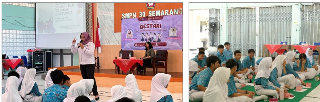
Gambar 4.19 Kondisi saat pemaparan materi

Melalui sesi talkshow , narasumber menjelaskan berbagai faktor yang dapat meningkatkan kerentanan remaja terhadap kekerasan seksual, di antaranya kurangnya pemahaman mengenai batasan diri, ketidakmampuan mengartikan persetujuan secara tepat, serta minimnya keberanian untuk mencari pertolongan saat mengalami situasi yang tidak nyaman akibat kurangnya dukungan dari lingkungan sekitar. Narasumber menekankan bahwa pencegahan kekerasan seksual dapat dimulai dengan mengenali batasan diri serta memahami konsep persetujuan ( consent ) yang sehat, agar korban merasa aman untuk bercerita dan memperoleh bantuan yang sesuai. Menanggapi hal tersebut, MC kemudian mempersilakan narasumber untuk memaparkan materi lebih lanjut mengenai consent dan personal boundaries .