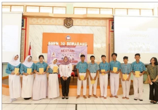
Gambar 4.28 Pembagian doorprize kepada peserta aktif

Rangkaian kegiatan BESTARI diakhiri dengan pembagian doorprize dan sesi penutupan. Sebanyak 10 peserta menerima doorprize sebagai bentuk apresiasi atas partisipasi aktif mereka selama kegiatan berlangsung. Peserta yang memperoleh doorprize di antaranya adalah peserta yang aktif menjawab pertanyaan, mengajukan pertanyaan kepada narasumber, serta berani menyampaikan hasil diskusi kelompok di depan peserta lain. Pemberian apresiasi ini bertujuan untuk mendorong keterlibatan peserta sekaligus meningkatkan kepercayaan diri mereka dalam mengikuti kegiatan. Suasana pembagian doorprize berlangsung meriah dan mendapat respons positif dari peserta. Antusiasme peserta terlihat selama proses pembagian hadiah, terutama ketika nama-nama peserta yang terpilih diumumkan