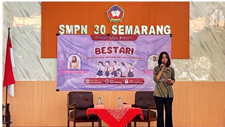
Gambar 4.14 Pembukaan acara oleh MC

Rangkaian kegiatan Talkshow BESTARI diawali dengan pembukaan acara yang dipandu oleh Master of Ceremony (MC). MC membuka kegiatan dengan menyampaikan salam kepada seluruh peserta, narasumber, panitia, serta tamu undangan yang hadir, antara lain Kepala Sekolah SMP Negeri 30 Semarang, Kepala UPTD PPA DP3A Kota Semarang, Psikolog DP3A Kota Semarang, dan Guru BK selaku pendamping acara. MC kemudian memperkenalkan diri dan memberikan informasi umum mengenai nama kegiatan, tagline , tujuan, dan susunan acara agar peserta memiliki gambaran mengenai pelaksanaan event .