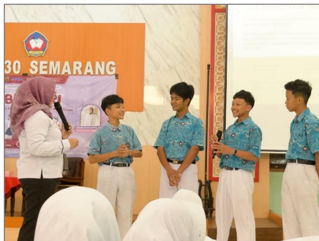
Gambar 4.20 Interaksi bersama peserta

Narasumber melanjutkan kegiatan dengan pemaparan materi mengenai consent dan personal boundaries . Sebelum memasuki materi utama, narasumber mengajak peserta mengikuti permainan sederhana berupa “Clap Boom” untuk menciptakan suasana yang lebih santai sekaligus meningkatkan fokus peserta. Materi diawali dengan penjelasan mengenai pengertian consent sebagai persetujuan yang diberikan secara sadar, sukarela, dan tanpa adanya paksaan. Narasumber kemudian menjelaskan prinsip-prinsip consent yang sehat serta berbagai bentuk consent yang dapat ditemui dalam kehidupan sehari-hari. Pembahasan dilanjutkan dengan materi mengenai personal boundaries atau batasan diri, meliputi pengertian, pentingnya menjaga batasan pribadi, contoh penerapannya dalam kehidupan sehari-hari, serta berbagai bentuk pelanggaran batasan pribadi yang sering dialami remaja. Peserta juga memperoleh pemahaman mengenai kekerasan seksual, termasuk berbagai bentuk perilaku yang tergolong sebagai kekerasan seksual, baik yang bersifat fisik maupun verbal. Narasumber menjelaskan mekanisme pelaporan kasus kekerasan seksual melalui UPTD PPA Kota Semarang sehingga peserta mengetahui langkah yang dapat dilakukan apabila mengalami atau mengetahui adanya kasus kekerasan seksual di lingkungan sekitar.