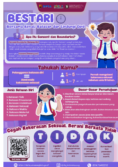
(Desain poster final)