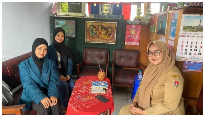
Gambar 4.6 Koordinasi pelaksanaan acara di SMPN 30 Semarang

Koordinasi pelaksanaan acara di SMP Negeri 30 Semarang dilakukan pada tanggal 12 Mei 2026 dengan menyerahkan surat rekomendasi pelaksanaan kegiatan dari Dinas Pendidikan Kota Semarang beserta Term of Reference (TOR) sebagai gambaran pelaksanaan kegiatan. Dalam kunjungan tersebut, penulis bertemu dengan kepala sekolah untuk menjelaskan garis besar pelaksanaan kegiatan. Berdasarkan hasil koordinasi, penulis diarahkan untuk melakukan koordinasi lanjutan dengan pendamping, yaitu guru Bimbingan dan Konseling (BK) yang akan mendampingi selama pelaksanaan acara di SMP Negeri 30 Semarang.