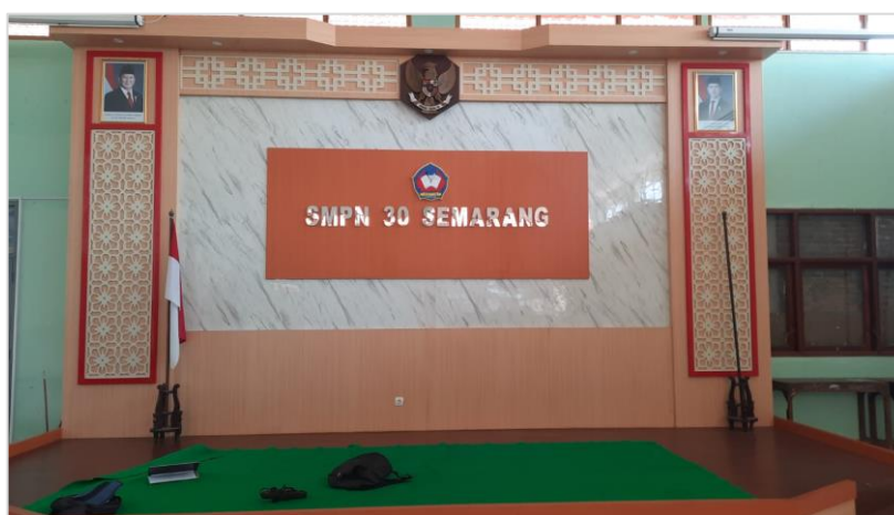
Gambar 4.7 Aula SMP Negeri 30 Semarang

Koordinasi lanjutan kemudian dilakukan pada tanggal 13 Mei 2026 bersama Rahmawati Cahyaningtyas, S.Pd. selaku guru BK untuk membahas teknis pelaksanaan kegiatan secara lebih rinci. Pembahasan meliputi penentuan peserta yang akan mengikuti kegiatan, koordinasi kelas yang dilibatkan, kebutuhan logistik dan fasilitas pendukung, susunan acara, penggunaan ruangan, serta teknis pendampingan siswa selama kegiatan berlangsung. Setelah berkoordinasi dan mendapat kesepakatan dengan guru pendamping, penulis diizinkan untuk meninjau Aula SMP Negeri 30 Semarang sebagai ruangan pelaksanaan acara.