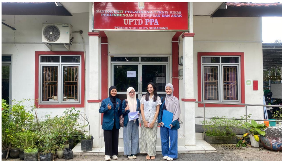
Gambar 4.2 Koordinasi dengan UPTD PPA Kota Semarang (Sumber: Dokumentasi penulis)

terkait kasus kekerasan seksual terhadap anak di Kota Semarang. Berdasarkan data yang disampaikan, Kecamatan Semarang Barat merupakan wilayah dengan jumlah kasus kekerasan seksual terhadap anak tertinggi dibandingkan kecamatan lainnya di Kota Semarang. Disampaikan pula bahwa tingginya jumlah kasus tersebut menunjukkan bahwa anak-anak di wilayah tersebut memiliki kerentanan yang lebih besar terhadap risiko terjadinya kekerasan seksual.