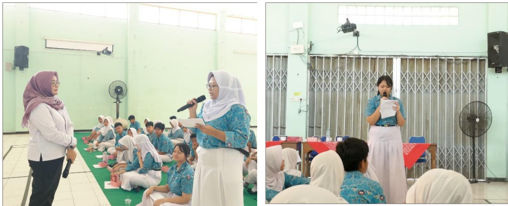
Gambar 4.21 Sesi tanya jawab oleh peserta dan narasumber

melibatkan peserta selama kegiatan berlangsung. Narasumber juga mengajak peserta untuk mempraktikkan cara merespons situasi ketika batasan pribadinya dilanggar sebagai bentuk penerapan materi yang telah dipelajari. Kegiatan ini memberikan kesempatan kepada peserta untuk melatih keberanian dalam menyampaikan batasan diri, serta memahami cara menghormati batasan yang dimiliki orang lain. Pada akhir sesi, narasumber membuka kesempatan bagi peserta untuk mengajukan pertanyaan terkait materi yang telah disampaikan. Saat sesi tanya jawab terdapat dua peserta mengajukan pertanyaan, kemudian pertanyaan dijawab oleh narasumber secara jelas.