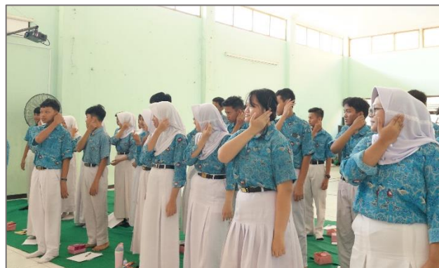
Gambar 4.22 Sesi ice breaking

Usai mengikuti sesi penyampaian materi, peserta diajak mengikuti kegiatan ice breaking yang dipandu oleh narasumber. Tujuan dari adanya ice breaking