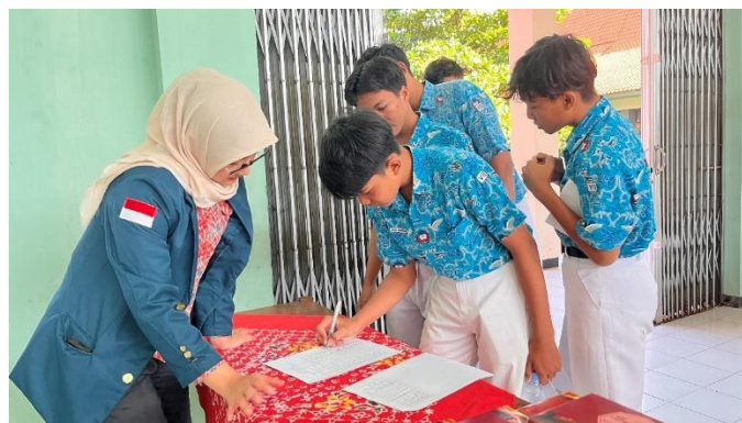
Gambar 4.13 Proses registrasi peserta

Sesi registrasi peserta dilaksanakan di depan pintu Aula SMP Negeri 30 Semarang pada pukul 07.45 WIB. Kegiatan ini diikuti oleh 30 peserta yang berasal dari kelas 7 dan 8. Pada sesi ini, peserta mengisi data kehadiran secara manual menggunakan daftar kehadiran berupa kertas, yang mencakup nama, kelas, jenis kelamin, dan tanda tangan. Setelah melakukan registrasi, peserta menerima konsumsi berupa snack yang telah disiapkan oleh panitia, kemudian peserta diarahkan oleh panitia untuk duduk sesuai dengan tempat yang telah disediakan.