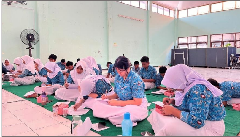
Gambar 4.17 Proses pengerjaan Pre-Test peserta

memberikan arahan mengenai tata cara pengisian dan memastikan seluruh peserta dapat mengerjakan kuesioner dengan baik. Tujuan dari pelaksanaan pre-test adalah untuk mengetahui tingkat pemahaman awal peserta mengenai konsep consent dan personal boundaries sebagai upaya pencegahan kekerasan seksual sebelum memperoleh edukasi melalui kegiatan talkshow BESTARI.