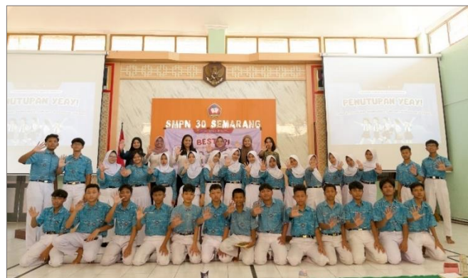
Gambar 4.29 Foto bersama narasumber dan peserta

Setelah pembagian doorprize selesai, kegiatan dilanjutkan dengan sesi penutupan yang dipandu oleh MC. MC menyampaikan closing statement yang berisi rangkuman singkat mengenai materi dan pesan utama yang telah diperoleh peserta selama kegiatan berlangsung, khususnya mengenai pentingnya memahami consent dan personal boundaries sebagai upaya pencegahan kekerasan seksual. MC juga mengajak peserta untuk menerapkan pengetahuan yang telah diperoleh dalam kehidupan sehari-hari serta menghormati batasan diri sendiri maupun orang lain.