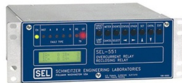
Gambar 1. Relay Proteksi SEL 551

Objek utama penelitian ini adalah Alamat Database milik Relay Proteksi SEL 551. Relay Proteksi SEL 551. Alamat database tersebut berperan dalam proses komunikasi antara Relay Proteksi SEL 551 dengan Master station .