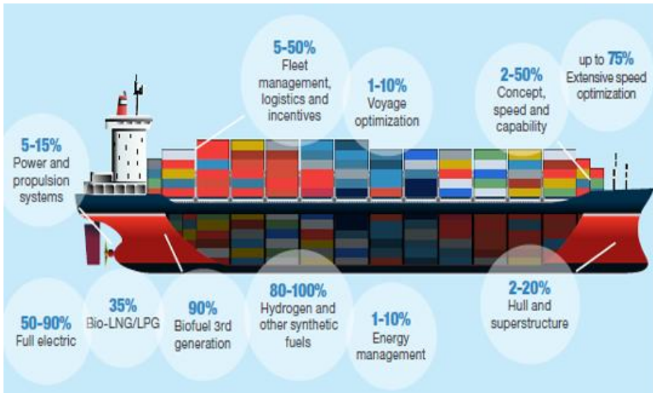
Gambar 1. 2 Solusi yang dapat diterapkan pada kapal

Dalam pemenuhan EEXI ada beberapa cara yang biasanya diimplementasikan. Salah satunya melakukan improvement energi terbarukan yaitu pemasangan teknologi ramah lingkungan, diantaranya seperti : batteries , wind-assisted propulsion , Waste Heat Recovery (WHR) , low Zero-carbon fuels , dan solar cell , dll. (Wiliyan et al., 2023). Salah satu pendekatan implementasi nya yaitu dari mesin utama sehingga mengurangi output daya yang digunakan untuk propulsi, dan menurunkan bahan bakar serta dengan ini dapat memperbaiki nilai EEXI kapal. Metode ini dinilai relatif mudah dijalankan untuk diterapkan secara teknis dibandingkan dengan trofit perangkat efisiensi energi yang kompleks atau perubahan design hull dan propulsi. (RINA, 2023).