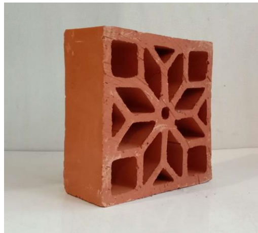
Gambar 2. 2 Roster Tanah Liat

Roster tanah liat merupakan elemen dinding berlubang yang dibuat dari bahan dasar tanah liat yang dicetak dengan pola tertentu kemudian dibakar pada suhu tinggi agar menjadi keras dan kuat. Roster jenis ini berfungsi sebagai ventilasi yang bersifat alami yang membuka peluang bagi udara dan cahaya untuk masuk ke dalam bangunan sehingga membantu menjaga sirkulasi udara tetap baik. Selain itu, roster tanah liat juga sering digunakan sebagai elemen dekoratif pada dinding atau fasad bangunan karena memiliki tampilan alami dan estetika khas material keramik. Contoh gambar roster tanah liat seperti pada Gambar 2.2