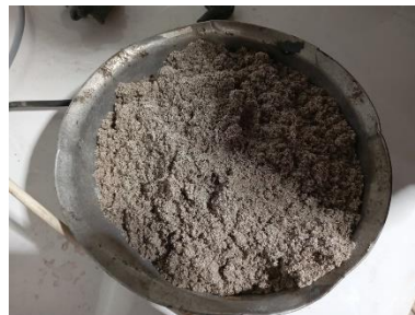
Gambar 2. 4 Abu Sekam Padi (RHA)

Di samping manfaat teknis tersebut, pemanfaatan abu sekam padi juga memberikan keuntungan dari aspek lingkungan. Penggunaan material ini mampu menurunkan penggunaan semen Portland yang proses produksinya menghasilkan emisi karbon cukup signifikan. Dengan demikian, pemanfaatan abu sekam padi dapat mendukung pengembangan material mortar yang lebih ramah lingkungan dan berkelanjutan, khususnya pada aplikasi non-struktural seperti pembuatan roster. Contoh abu sekam padi seperti pada Gambar 2.4.