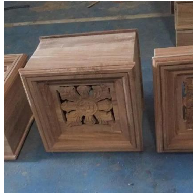
Gambar 2. 3 Roster Kayu