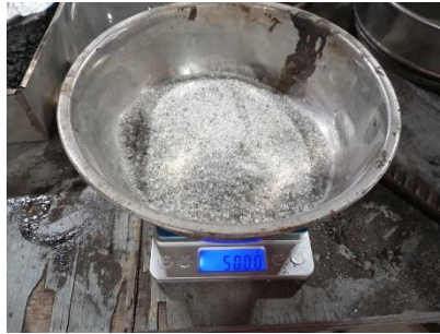
Gambar 2. 5 Limbah Serbuk Kaca