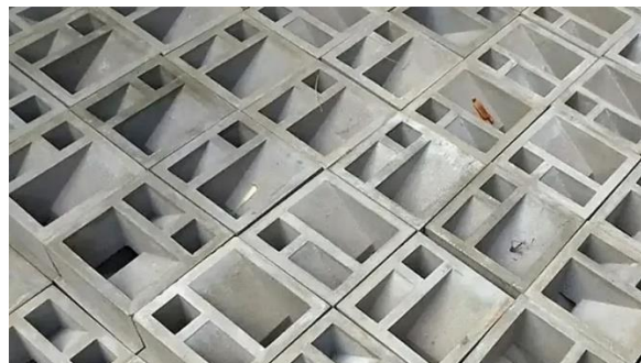
Gambar 2. 1 Roster Mortar

Roster mortar merupakan elemen bangunan berbentuk blok berlubang yang umumnya dibuat dari campuran semen, pasir, dan air, kemudian dicetak dengan pola tertentu. Roster ini difungsikan sebagai ventilasi alami pada dinding bangunan sehingga memungkinkan sirkulasi udara dan cahaya masuk tanpa mengurangi privasi ruang. Selain itu, roster mortar juga sering dimanfaatkan sebagai elemen estetika pada fasad bangunan karena memiliki berbagai variasi bentuk dan motif yang dapat memperindah tampilan arsitektur. Contoh roster mortar seperti pada Gambar 2.1