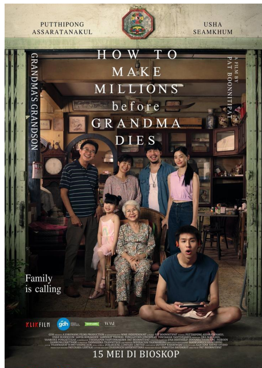
Gambar 1.1 Poster film How to Make Millions Before Grandma Dies

pada tahap akhir, How to Make Millions Before Grandma Dies (2024) mencetak sejarah sebagai film pertama Thailand yang menembus daftar calon nominasi ajang penghargaan film tertinggi dunia tersebut sejak tahun 1984.