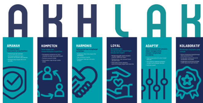
Gambar 2. 2 Core Values BUMN

Core Values AKHLAK terdiri atas enam nilai utama, yaitu: