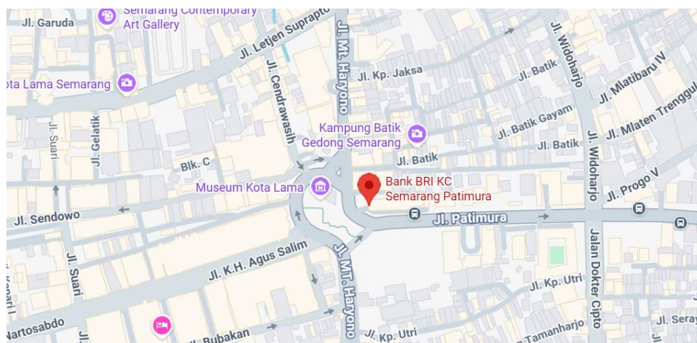
Gambar 2. 3 Lokasi PT Bank Rakyat Indonesia (Persero) Tbk Kantor Cabang Semarang Pattimura

BRI KC Semarang Pattimura berlokasi di Jl. Patimura No. 2-4, Kecamatan Semarang Timur, Kota Semarang, Jawa Tengah 50227.