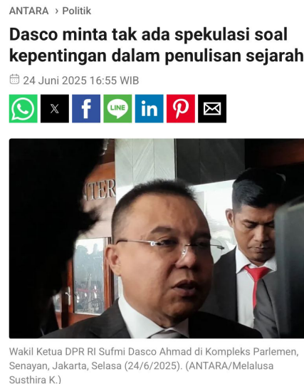
Gambar 1.4 Tangkapan Layar Artikel AntaraNews.com

sejarawan dari berbagai bidang. Nada pemberitaan moderat dan edukatif, menekankan perlunya keseimbangan antara tujuan nasional dan prinsip keilmuan agar sejarah tetap kredibel dan berbasis fakta.