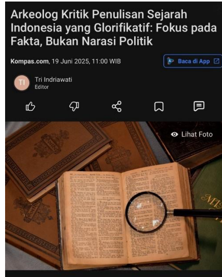
Gambar 1.3 Tangkapan Layar Artikel Kompas.com

penulisan ulang sejarah Indonesia pada periode Mei hingga September 2025, terlihat kecenderungan Kompas.com menyoroti proses dan pendekatan ilmiah dalam penulisan ulang sejarah Indonesia.