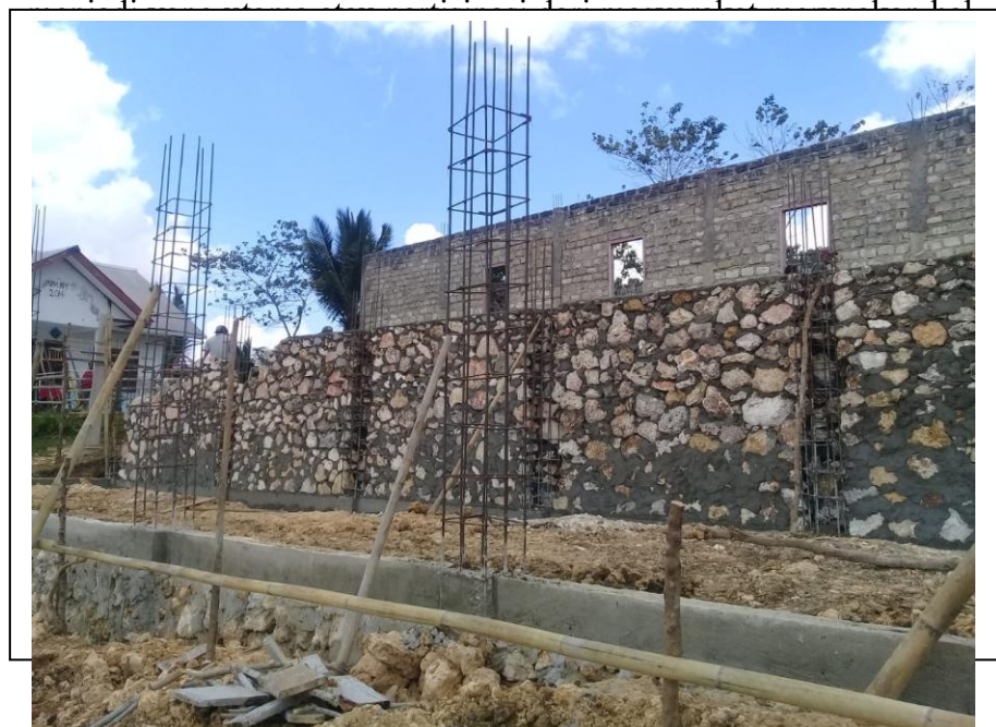
Sumber : data penelitian, 2018

Cara ini sangat baik dikarenakan akan sangat efektif bila dalam proses perencanaan pembangunan masyarakat selalu dilibatkan sehingga peran serta dari masyarakat itu terlihat dari apa yang kemukakan oleh masyarakat sehingga secara tidak langsung masyarakat sudah berpartisipasi dalam proses perkembangan pembangunan di desa. Apa yang masyarakat inginkan bisa dipenuhi bersama terutama masalah pembangunan. Cara ini dianggap sebagai cara yang mampu mempengaruhi masyarakat untuk ikut bekerja dan juga dapat meningkatkan pemahaman dari masyarakat bahwa dalam proses pembangunan dalam desa peran serta dari masyarakat selalu