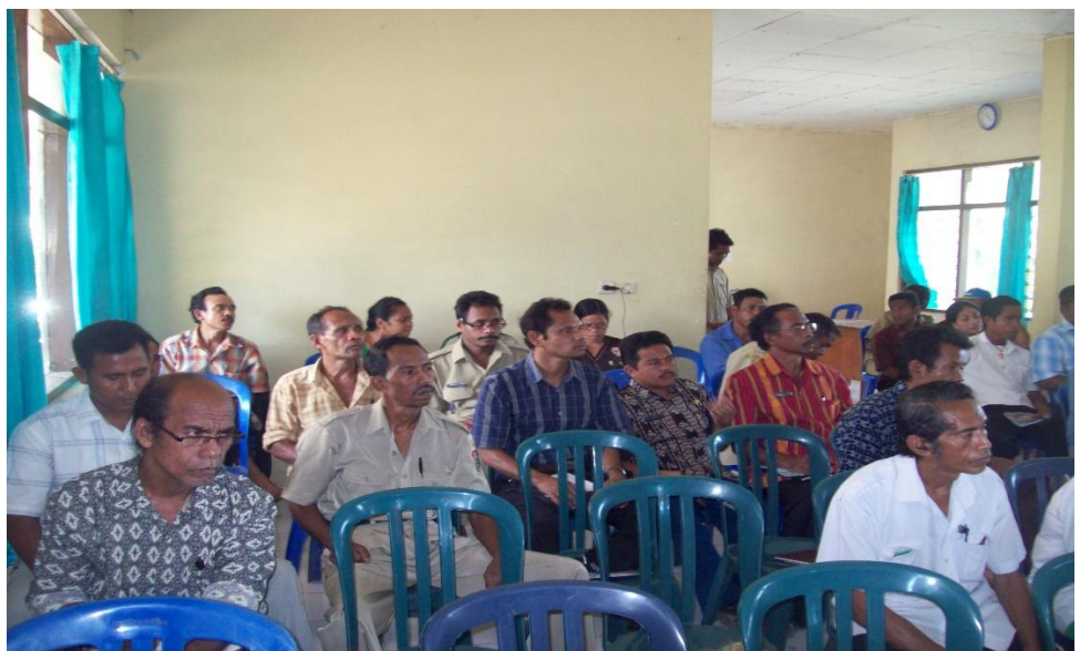
Gambar 4.3 Kegiatan Partisipasi Masyarakat dalam Pelaksanaan Dana Desa

Program Ini sejak awal berjalan memang kami kurang sosialisasi, namun pada tahun berikut baru kami mulai aktif sosialisasi, kami sosialisasi kepada setiap kecamatan, kami melakukan pertemuan di setiap kecamatan dan kami undang setiap warga desa, kepala desa, tokoh masyarakat, tokoh agama dan beberapa warga yang masuk dalam penerima dana tersebut. (Wawancara, Tanggal : 21 Juni 2018)