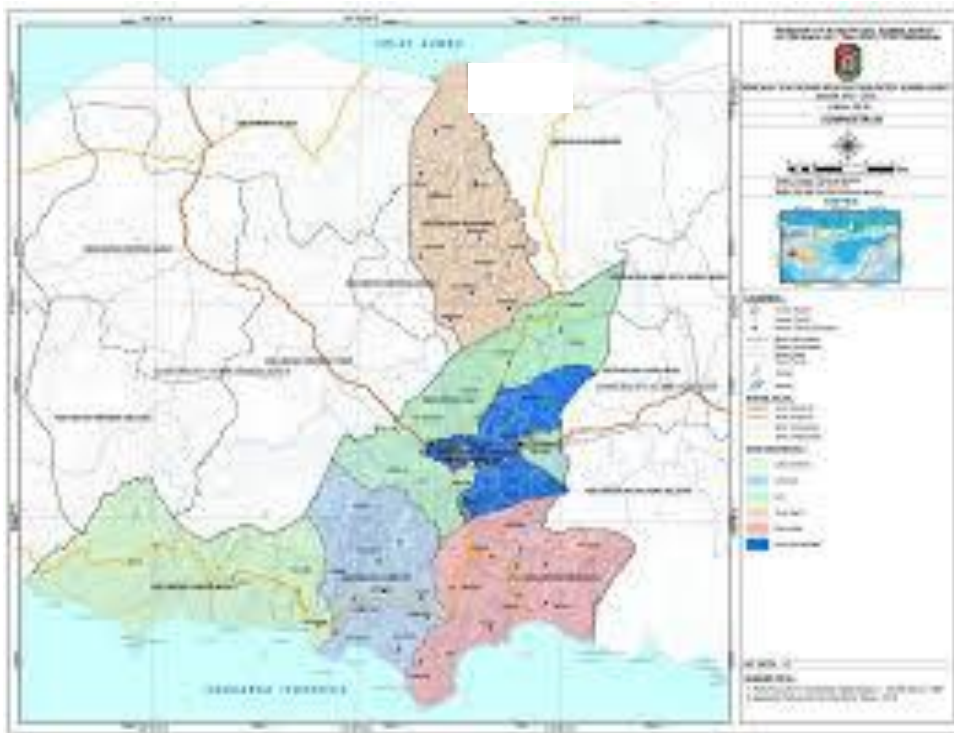
Gambar 4.1 Peta Wilayah Kecamatan Loli

Kecamatan Loli terdiri dari 9 desa yaitu Desa Dedekadu, Desa Beradolu, Desa Tema Tana, Desa Tana Rara, Desa Ubu Pede, Desa Dokakaka, Desa Ubu Raya dan Desa Manola serta 5 Kelurahan. yaitu Kelurahan Wee Karou, Kelurahan, Wee Dabbo, Kelurahan Loda Pare, Kelurahan Sobawawi, dan Kelurahan Dira Tana. Wilayah Kecamatan ini