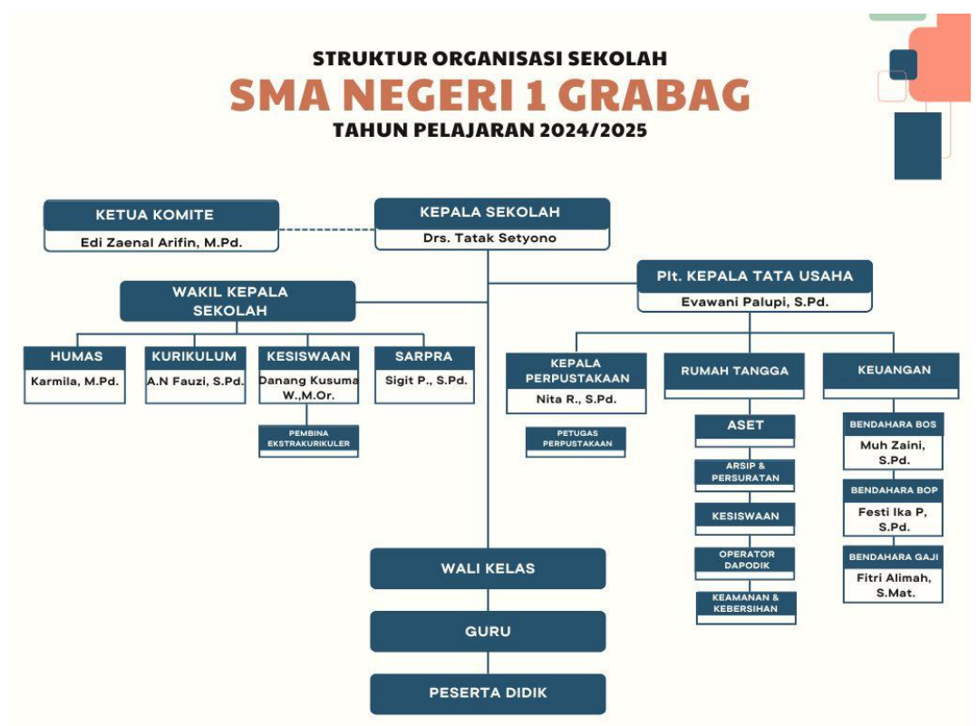
Gambar 2. 1 Struktur Organisasi SMA Negeri 1 Grabag

Untuk mengelola organisasi dan tata kerja, satuan pendidikan ini memiliki susunan organisasi dengan pimpinan tertinggi Kepala Sekolah dan diawasi oleh Komite Sekolah. Sedangkan dalam menjalankan tugas dan fungsi manajerial, Kepala Sekolah dibantu oleh Kepala Tata Usaha dan Wakil Kepala Sekolah Bidang Kurikulum, Kesiswaan, Sarana Prasarana, Hubungan Masyarakat, serta Guru yang memiliki peran utama untuk menyelenggarakan pembelajaran. Pengelolaan manajerial SMA Negeri 1 Grabag digambarkan dalam struktur organisasi sebagai berikut :