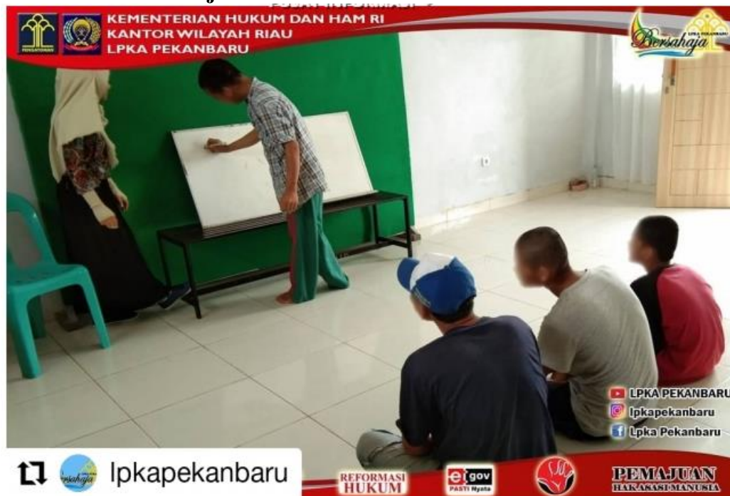
Gambar 1.1 Bentuk Kebijakan Pendidikan di LPKA Kelas II Pekanbaru

pembinaan kreasi dan keterampilan, sarana dan prasarana yang ada masih belum dapat menunjang bakat anak secara keseluruhan.