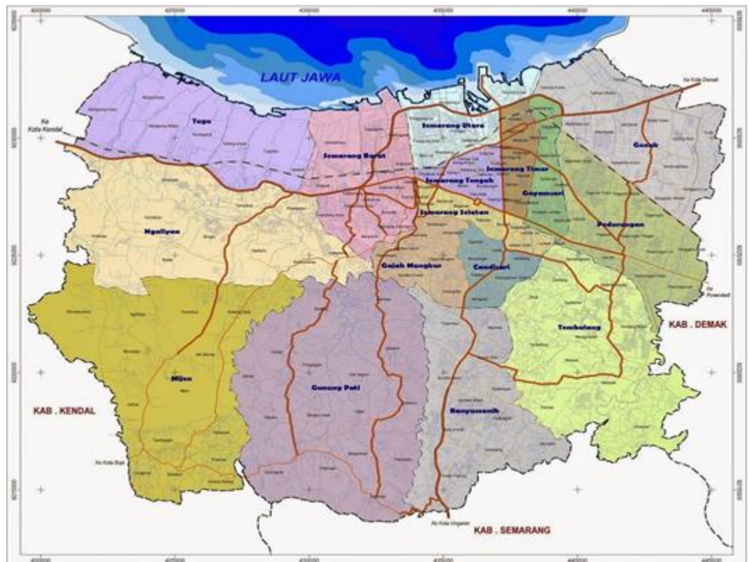
Gambar 2.1. Peta Administrasi Kota Semarang

Kota Semarang memiliki posisi geostrategis karena terletak di persimpangan ekonomi pulau Jawa dan merupakan koridor pembangunan Jawa Tengah yang terdiri dari empat simpul pintu masuk yaitu Koridor Pesisir Utara; koridor selatan menuju kota-kota dinamis seperti Kabupaten Magelang, Surakarta dikenal dengan Koridor Merpapi-Merbabu, koridor timur menuju Kabupaten Demak dan koridor barat menuju Kabupaten Kendal.