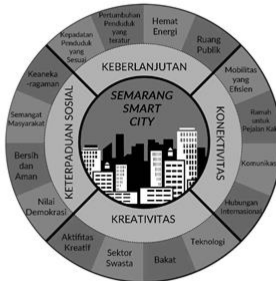
Gambar 2.3. Indikator Pemikiran Smart City Semarang

Indikator Kota Cerdas Kota Semarang Rumusan 4K yang merupakan visi dari kota cerdas Kota Semarang yang masing-masing dari 4K tersebut adalah keberlanjutan, konektivitas, kreatifitas, dan keterpaduan sosial. Dan masing-masing point dari 4K tersebut memiliki sub-sub point yang menjadi tolak ukur dari 4K tersebut.