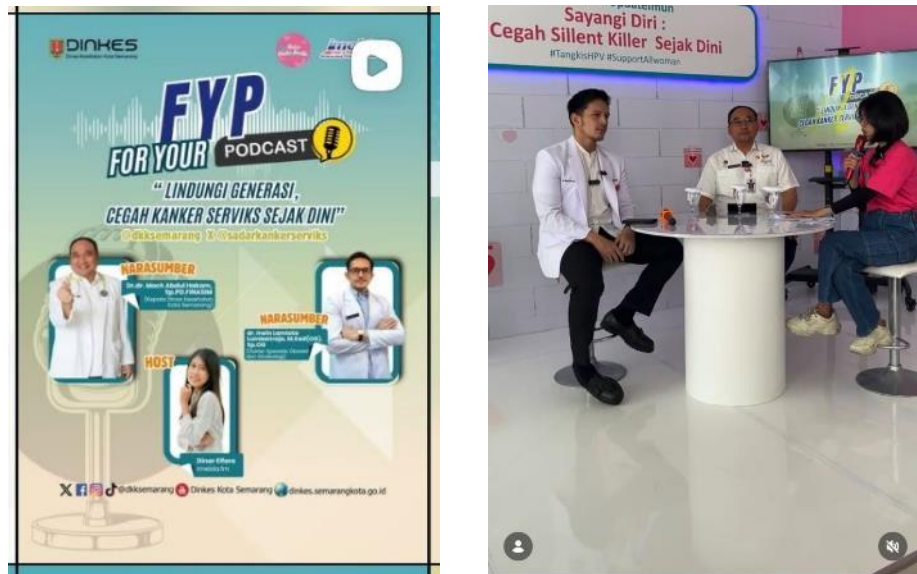
Gambar 2.11. Program Komunikasi FYP

Program siaran langsung yang bekerja sama dengan Radio Imelda FM memberikan edukasi mengenai kesehatan fisik seperti mencegah kanker serviks sejak dini.