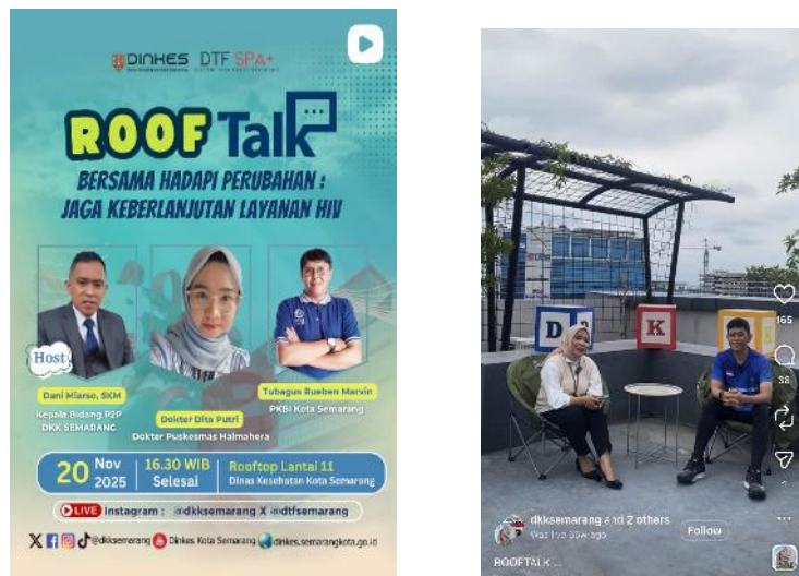
Gambar 2.12. Program Komunikasi Roof Talk

Program kolaboratif yang melibatkan komunitas kesehatan, olahraga, dan lingkungan di Kota Semarang. Program ini berfungsi sebagai ruang bertukar pikiran dan gagasan antara Dinas Kesehatan Kota Semarang dan juga komunitas, sekaligus memperkuat jaringan kolaborasi promosi kesehatan bersama dengan masyarakat.