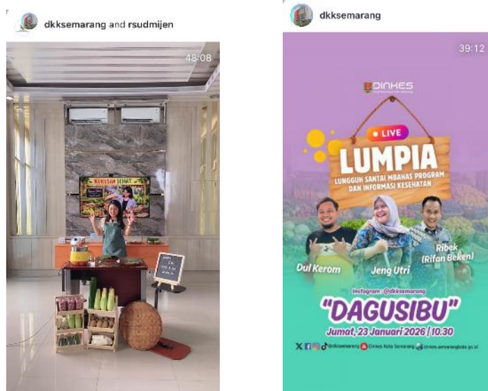
Gambar 2. 7 Program Komunikasi LUMPIA