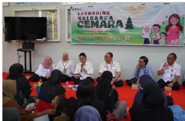
Gambar 2.3. Program Inovasi Keluarga Cemara

Program Keluarga Cemara (Kelas Khusus untuk Cegah Stunting dan Masalah Gizi Terintegrasi) merupakan program inovasi Dinas Kesehatan Kota Semarang yang bertujuan untuk menurunkan angka stunting melalui kegiatan edukasi interaktif,