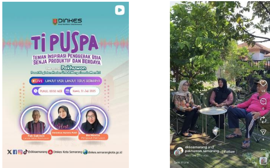
Gambar 2.10. Program Komunikasi TIPUSPA