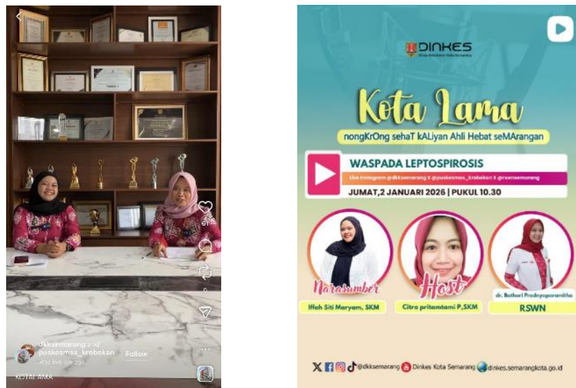
Gambar 2.8. Program Komunikasi KOTA LAMA

Program siaran langsung yang membahas seputar isu kesehatan bersama dengan narasumber yang memiliki keahlian di bidangnya masing masing. Program ini berfokus pada penyampaian informasi di topik spesifik dengan narasumber kredibel sekaligus memberikan ruang diskusi bagi masyarakat untuk bertanya seputar topik yang dibahas.