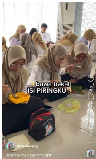
Gambar 2.9. Program Komunikasi BURUDAKU

Program komunikasi yang bertujuan untuk mempromosikan gerakan mengonsumsi makanan sehat sesuai dengan anjuran “Isi Piringku”. Program ini berfungsi sebagai media edukasi gizi seimbang dengan pendekatan yang persuasif sehingga masyarakat terdorong untuk menerapkan pola makan yang sehat di kehidupan sehari-hari.