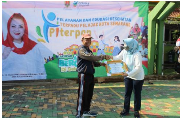
Gambar 2.4. Program Inovasi PITERPAN