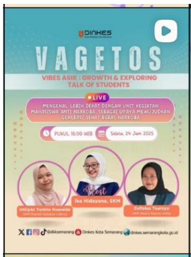
Gambar 2.13. Program Komunikasi VAG