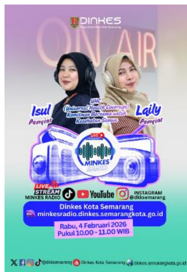
Gambar 2. 6 Program Komunikasi Minkes Radio

Program siaran yang membahas mengenai isu-isu kesehatan terkini melalui format talk show interaktif. Program ini melibatkan penyiar sebagai fasilitator dan membuka ruang partisipasi bagi para pendengar di fitur live chat untuk berdiskusi atau mengajukan pertanyaan.