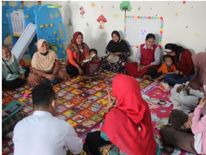
Gambar 2.5. Program Inovasi Rumah Pelita

Seperti yang telah dijelaskan pada bagian sebelumnya, program pelayanan dasar Dinas Kesehatan Kota Semarang dalam aspek pencegahan dan pengendalian penyakit juga mencakup berbagai upaya dalam menangani kesehatan mental, salah satunya melalui penyediaan layanan skrining kesehatan mental yang dapat diakses oleh masyarakat. Keberadaan layanan ini merupakan bagian dari strategi deteksi dini yang bertujuan untuk mengidentifikasi kondisi kesehatan mental sejak tahap awal serta meningkatkan kesadaran masyarakat terhadap pentingnya kesehatan mental. Namun, tersedianya layanan skrining kesehatan mental secara menyeluruh di puskesmas Kota Semarang belum tersosialisasikan secara optimal kepada masyarakat Kota Semarang. Tingkat kesadaran, pengetahuan, dan pemanfaatan layanan skrining kesehatan mental oleh Dinas Kesehatan Kota Semarang masih tergolong rendah. Berdasarkan data per Januari 2025, dari total 2.091.480 penduduk Kota Semarang, terdapat 10 puskesmas yang mencatat angka 0 pada jumlah masyarakat yang memanfaatkan layanan skrining kesehatan mental. Selain itu, hasil survei terhadap 236 responden berusia 18–25 tahun menunjukkan bahwa sebagian besar responden tidak mengetahui keberadaan layanan tersebut serta merasa enggan untuk mengaksesnya karena kekhawatiran terhadap stigma sosial.