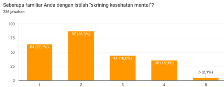
Gambar 1.1 Familiaritas masyarakat Banyumanik dan Tembalang terhadap istilah Skrining Kesehatan Mental.

Selain itu kesadaran atau awareness juga diukur melalui beberapa pertanyaan lainnya seperti yang tertera pada gambar 1.2., 1.3., dan juga 1.4., Pertanyaan pada gambar 2, yaitu “Menurut saya, skrining kesehatan mental penting untuk dilakukan” lalu selanjutnya pada gambar 3, berisikan pertanyaan “Menurut saya, skrining kesehatan mental dapat membantu deteksi dini gangguan kesehatan mental” dan pada pertanyaan terakhir, yaitu gambar 4, terdapat pertanyaan “Apakah Anda mengetahui bahwa puskesmas di kecamatan Anda menawarkan layanan skrining kesehatan mental?”. Dari 4 pertanyaan yang diukur melalui scale tersebut, dapat dibuktikan bahwa kesadaran masyarakat Banyumanik dan Tembalang mengenai Layanan Skrining Kesehatan Mental masih berada di angka yang cukup rendah dan membutuhkan strategi yang efektif agar dapat meningkatkan kesadaran masyarakat.