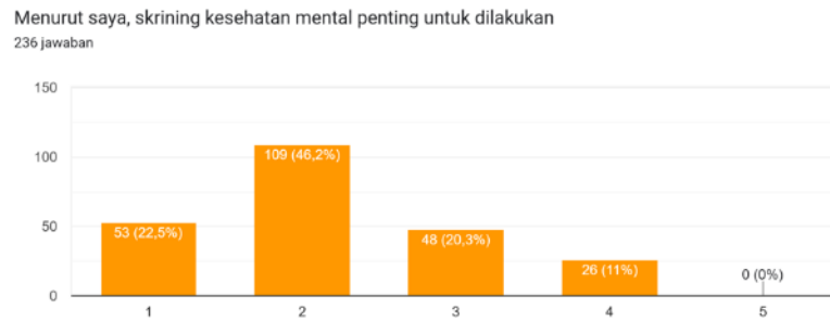
Gambar 1.2. Skrining Kesehatan Mental sebagai Sarana Deteksi Dini Gangguan Mental