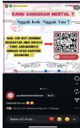
Gambar 1.8. Publikasi poster layanan skrining kesehatan mental pada Instagram @puskesmassekar

Berdasarkan data tersebut, Dinas Kesehatan Kota Semarang membutuhkan strategi komunikasi yang dapat membantu meningkatkan kesadaran, pengetahuan, tingkat partisipasi masyarakat dan menurunkan stigma negatif pada dua daerah utama yang memerlukan perhatian khusus yaitu Kecamatan Banyumanik dan juga Kecamatan Tembalang. Melalui pemilihan kedua wilayah tersebut, diharapkan bahwa pendekatan dan strategi yang dilakukan dapat memberikan hasil yang optimal dalam meningkatkan jumlah kesadaran, pengetahuan, partisipasi pada layanan skrining kesehatan mental, dan mengurangi stigma negatif, serta dapat mencegah bahkan mengurangi kasus kesehatan mental di Semarang.