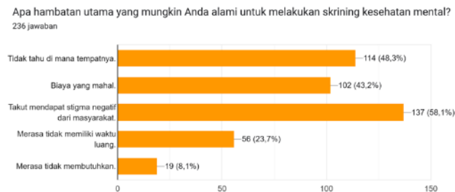
Gambar 1.9 . Survei hambatan melakukan skrining kesehatan mental

Dari grafik di atas, dapat disimpulkan bahwa terdapat tiga hambatan utama yang paling banyak dialami masyarakat dalam melakukan skrining kesehatan mental, yaitu “Takut mendapat stigma negatif dari masyarakat” (58,1%), “Tidak tahu di mana tempatnya” (48,3%), dan “Biaya yang mahal” (43,2%).