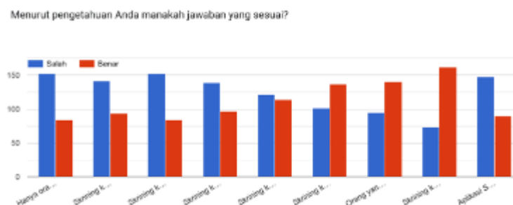
Gambar 1.6. Survei Pengetahuan mengenai skrining kesehatan mental

Namun, hal tersebut belum diimbangi dengan pengetahuan tentang layanan skrining kesehatan mental yang memadai. Hal ini dikonfirmasi oleh tingkat pengetahuan dari 236 responden yang berada pada persentase 49,52% yang didapatkan dari 9 pertanyaan salah-benar yang dilampirkan pada gambar berikut: