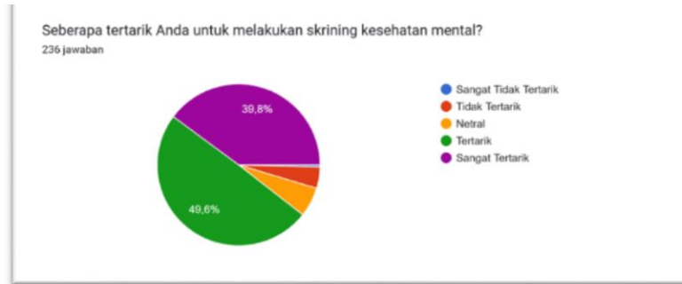
Gambar 1.5. Tingkat ketertarikan masyarakat untuk melakukan Skrining Kesehatan Mental

Berdasarkan data tersebut, dapat diketahui bahwa sebenarnya minat masyarakat terhadap pelayanan skrining Kesehatan mental cukup tinggi.