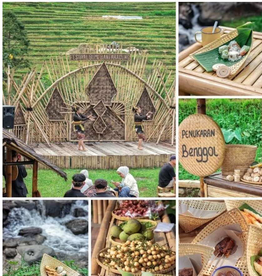
Gambar 2.6 Pasar Bumi Pakuwon