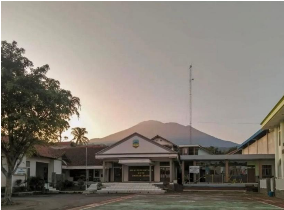
Gambar 2.1 Desa Wisata Bantaragung