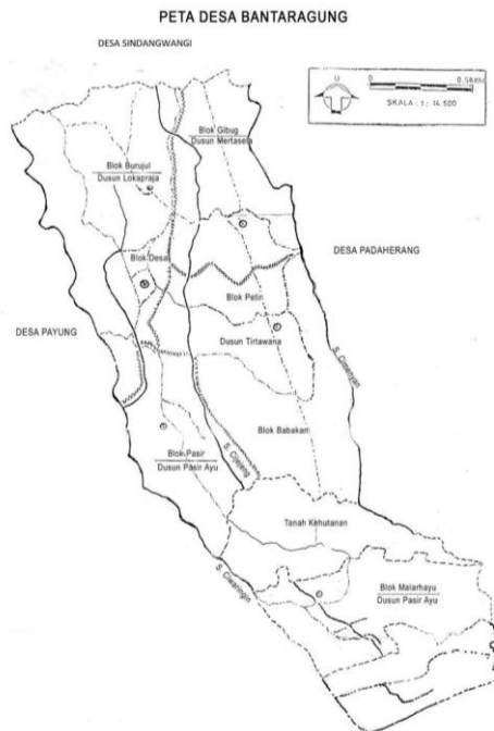
Gambar 2.3 Peta Desa Bantaragung