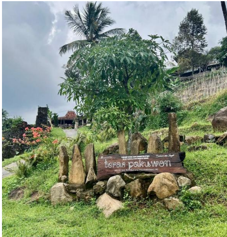
Gambar 2.5 Teras Pakuwon

Kawasan Teras Pakuwon merupakan salah satu kawasan wisata yang berkembang di Desa Wisata Bantaragung dengan mengandalkan lanskap persawahan sebagai daya tarik utama. Kawasan ini menampilkan hamparan sawah berteras yang mengikuti kontur lahan, dengan latar perbukitan dan jalur Ciboer Pass. Pemandangan tersebut memberikan kesan ruang terbuka pedesaan yang masih alami dan menjadi daya tarik bagi wisatawan yang ingin menikmati suasana desa.