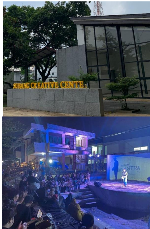
Gambar 2. 7 Gedung Creative Center Kabupaten Subang