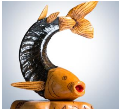
Gambar 2. 4 Imocraft