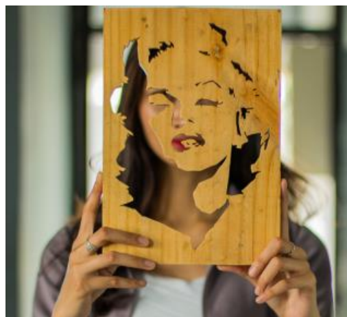
Gambar 2. 5 Sahabat Baik Studio