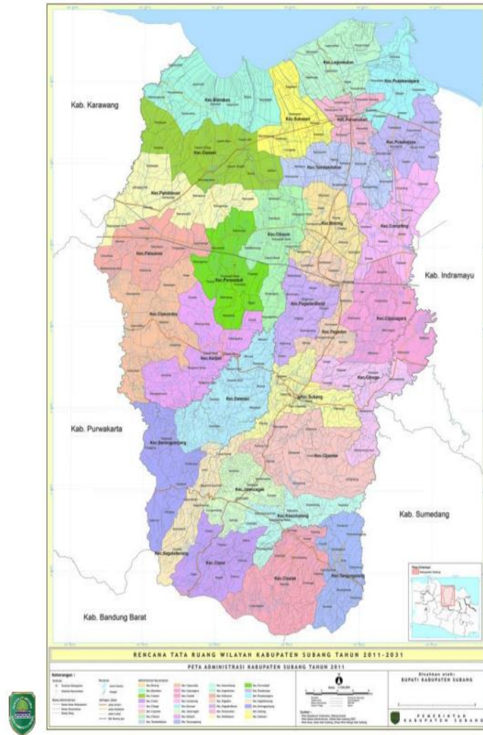
Gambar 2. 1 Peta Administrasi Kabupaten Subang

Sumber: Peraturan Daerah Kabupaten Subang Nomor 3 Tahun 2014 tentang Wilayah Kabupaten Subang Tahun 2011-2031.