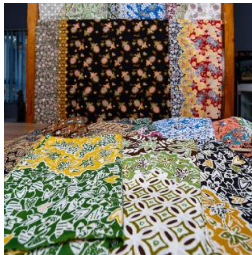
Gambar 2. 2 Batik Ganasan Khas Subang