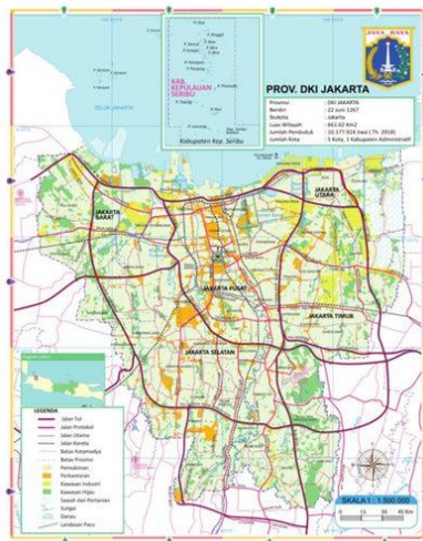
Gambar 1. 1 Peta Administrasi Provinsi DKI Jakarta

Provinsi Daerah Khusus Ibukota (DKI) Jakarta merupakan wilayah yang memiliki kedudukan khusus sebagai ibu kota negara Republik Indonesia. Selain berfungsi sebagai pusat pemerintahan, Jakarta juga menjadi pusat kegiatan ekonomi, politik, sosial, dan budaya. Status kekhususan tersebut diatur dalam berbagai peraturan perundang-undangan, yang menempatkan otonomi daerah DKI Jakarta berada pada tingkat provinsi, bukan pada tingkat kota seperti daerah lainnya di Indonesia.