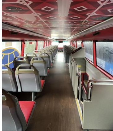
Gambar 2. 6 Interior Bus Wisata Kota Semarang