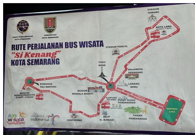
Gambar 2. 7 Rute Bus Wisata Kota Semarang

Bus Wisata Kota Semarang melayani perjalanan setiap hari dengan empat kali jadwal keberangkatan, yaitu pukul 08.00, 10.00, 15.00, dan 19.00 WIB, sehingga masyarakat dapat memilih waktu yang sesuai dengan kebutuhan. Pendaftaran dapat dilakukan secara langsung di Museum Ronggowarsito mulai pukul 07.00 WIB, maupun secara daring melalui laman resmi buswisata.dishub.semarangkota.go.id . Untuk melakukan pendaftaran, masyarakat cukup menunjukkan Kartu Tanda Penduduk (KTP), dengan ketentuan satu KTP dapat digunakan untuk dua orang penumpang. Sistem pendaftaran terbuka bagi individu maupun rombongan. Bagi pendaftar rombongan, diperlukan pengajuan surat permohonan resmi kepada Dinas Perhubungan Kota Semarang, baik melalui email dishubkotasmg@gmail.com maupun secara langsung ke kantor yang beralamat di Jl. Tambak Aji Raya No. 5, Tambakaji, Ngaliyan.