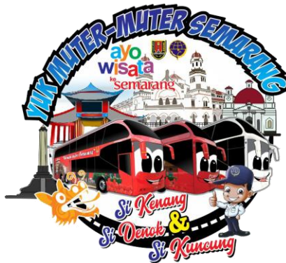
Gambar 2. 1 Logo Bus Wisata Kota Semarang