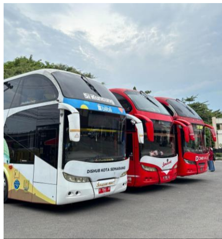
Gambar 2. 5 Armada Bus Wisata Kota Semarang

memperkenalkan kekayaan sejarah, budaya, dan berbagai destinasi unggulan yang dimiliki Kota Semarang. Konsep layanan dirancang tidak hanya sebagai sarana rekreasi, tetapi juga sebagai media pembelajaran yang informatif. Selama perjalanan berlangsung, penumpang didampingi oleh tour guide yang memberikan penjelasan mengenai lokasi-lokasi yang dilalui. Melalui pendampingan tersebut, perjalanan tidak sekadar menjadi aktivitas berwisata, tetapi juga menjadi kesempatan bagi penumpang untuk memahami sejarah dan karakteristik Kota Semarang secara lebih mendalam.