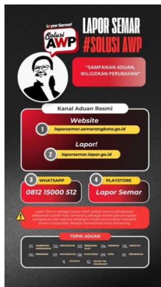
Gambar 2.3 Tampilan Antarmuka Platform Lapor Semar