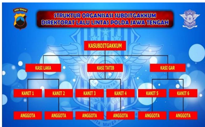
Gambar 2. 2 Struktur Organisasi Ditlantas Polda Jawa Tengah