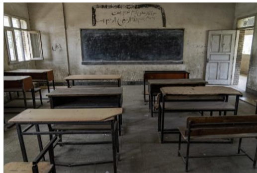
Gambar 2. 1 Ruang Kelas yang Kosong Akibat dari Rezim Pembatasan Taliban

Meskipun terdapat beberapa sekolah dasar perempuan yang masih melaksanakan kegiatan belajar mengajar di wilayah tertentu, tingkat partisipasi nasional mengalami penurunan drastis menjadi sekitar 39% pada tahun 2022. Penurunan ini utamanya terjadi di daerah pedesaan yang dipengaruhi oleh norma budaya yang konservatif, beban biaya pendidikan yang relatif tinggi, serta kekhawatiran orang tua akan keamanan anak perempuan mereka terkait ancaman kekerasan dan penculikan. Berdasarkan laporan UNESCO tahun 2024, sekitar 80% anak perempuan usia sekolah yang setara dengan total 2,5 juta jiwa terdampak secara keseluruhan. Dari jumlah tersebut, 1,4 juta anak perempuan kehilangan akses khusus pada jenjang pendidikan menengah, dan angka ini meningkat menjadi 2,2 juta pada tahun 2025 (UNESCO, 2024; UNESCO, 2025).