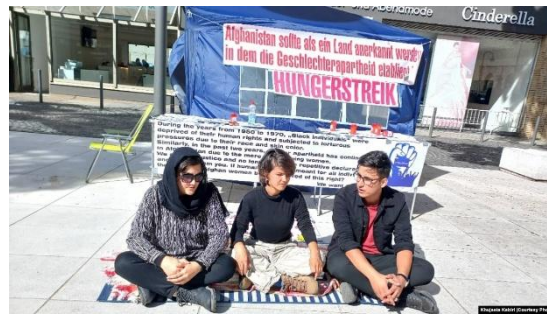
Gambar 2. 7 Hunger Strike dan Politik Solidaritas Global

untuk menarik perhatian internasional terhadap apa yang mereka sebut sebagai “ gender apartheid ” di Afghanistan. Ini merupakan bentuk solidaritas global untuk menahan sikap pasif komunitas internasional terhadap pelanggaran hak perempuan.