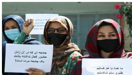
Gambar 2. 5 Demonstrasi Perempuan Afganistan Menentang Pembatasan Hak Perempuan oleh Taliban