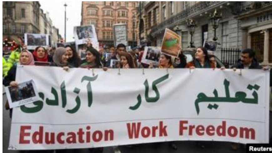
Gambar 2. 2 Demonstrasi Perempuan dan Anak Perempuan di Depan Kementerian Pendidikan Menuntut Hak untuk Sekolah

2030 memperkirakan 4 juta gadis terpinggirkan, menghambat pembangunan nasional secara keseluruhan (Devpolicy Blog, 2025).