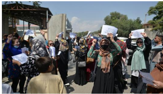
Gambar 2. 4 Demonstrasi Warga di Dasht-e-Barchi, Kabul yang dihentikan oleh Anggota Taliban

Source: UNAMA and HRW documentation of protest suppression in Kabul