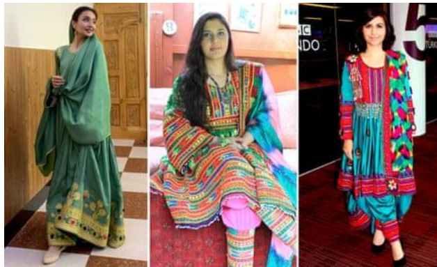
Gambar 2. 6 Penggunaan Pakaian Tradisional sebagai Simbol Identitas dan Resistensi Perempuan Afghanistan