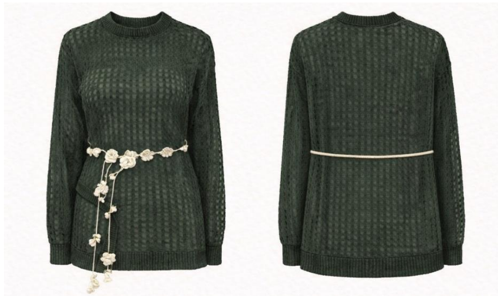
Gambar 2. 6 Produk NIRALUNA: Flower Whisper

Flower Whisper dirancang dengan tekstur rajut berpola halus dan siluet panjang yang memberikan kesan anggun, dilengkapi dengan detail belt tipis bermotif bunga sebagai aksen dekoratif sekaligus penegas bentuk tubuh. Desain ini mengutamakan keseimbangan antara estetika dan kenyamanan, sehingga sesuai digunakan dalam berbagai konteks gaya hidup.