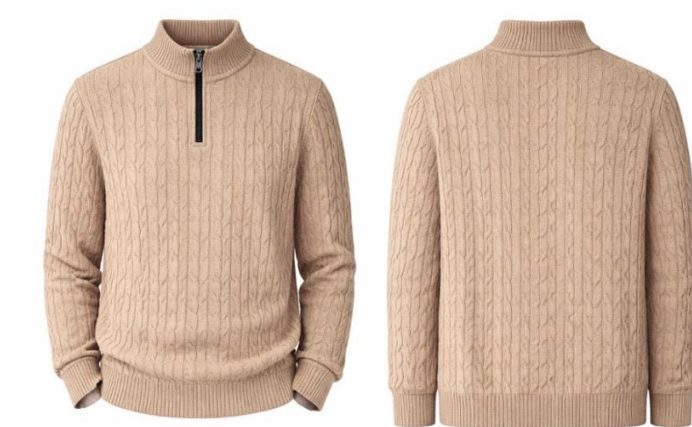
Gambar 2. 8 Produk NIRALUNA: Rowan Classic