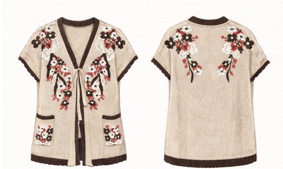
Gambar 2. 7 Produk NIRALUNA: Bloomvale

Bloomvale menghadirkan karakter lembut dan artistik melalui motif bunga rajut pada bagian depan dan belakang. Potongan outer berlengan pendek dengan bukaan depan memberikan kesan ringan dan nyaman, sementara kombinasi warna krem, coklat, dan sentuhan merah menciptakan tampilan klasik namun tetap modern.