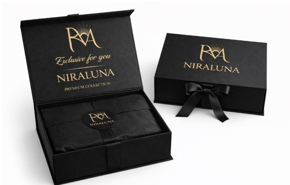
Gambar 2. 10 Packaging Produk NIRALUNA

minimalis. Desain kemasan tidak hanya berfungsi sebagai pelindung produk, tetapi juga sebagai elemen pendukung pengalaman konsumen ( customer experience ). Melalui pemilihan material dan desain yang tepat, kemasan diharapkan mampu memperkuat persepsi kualitas dan eksklusivitas merek.