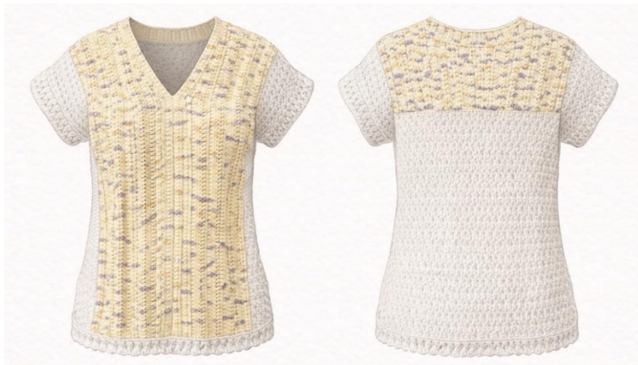
Gambar 2. 3 Produk NIRA: Banana Top

Atasan rajut bernuansa krem dengan panel depan berwarna kuning bermotif rajut berpola unik yang menjadi focal point desain. Potongan leher V memberikan kesan jenjang dan feminin, sementara bagian samping dan belakang menggunakan rajutan polos berwarna netral untuk keseimbangan visual.