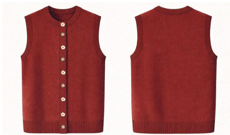
Gambar 2. 5 Produk NIRALUNA: Scarlet Petal