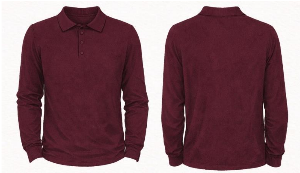
Gambar 2. 9 Produk NIRALUNA: Alder

Sweater rajut dengan motif cable knit klasik yang memberikan kesan hangat dan premium. Didesain dengan detail resleting setengah ( half-zip ) dan kerah tinggi, menghadirkan tampilan modern sekaligus fungsional. Potongan long sleeve dengan rib di bagian manset dan hem bawah menambah kesan rapi dan nyaman.