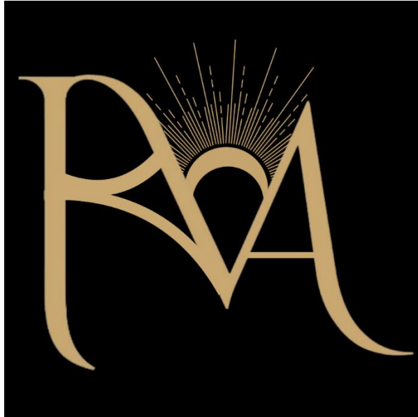
Gambar 2. 1 Logo NIRALUNA

Merujuk pada Gambar 2.1 Logo NIRALUNA yang merepresentasikan identitas merek yang elegan, berkelas, dan berorientasi pada pertumbuhan jangka panjang. Desain logo mencerminkan nilai inti perusahaan yang mencakup keindahan, keseimbangan, dan kekuatan karakter. Logo NIRALUNA merepresentasikan perempuan yang tumbuh, bersinar, dan berani mengekspresikan dirinya dengan elegan. Sebuah simbol bahwa keindahan sejati lahir dari kepercayaan diri dan karakter yang kuat. Dengan pendekatan visual yang minimalis namun berwibawa, logo NIRALUNA dirancang untuk mendukung positioning brand sebagai label knitwear yang matang dan memiliki karakter kuat di industri fashion dan lifestyle .