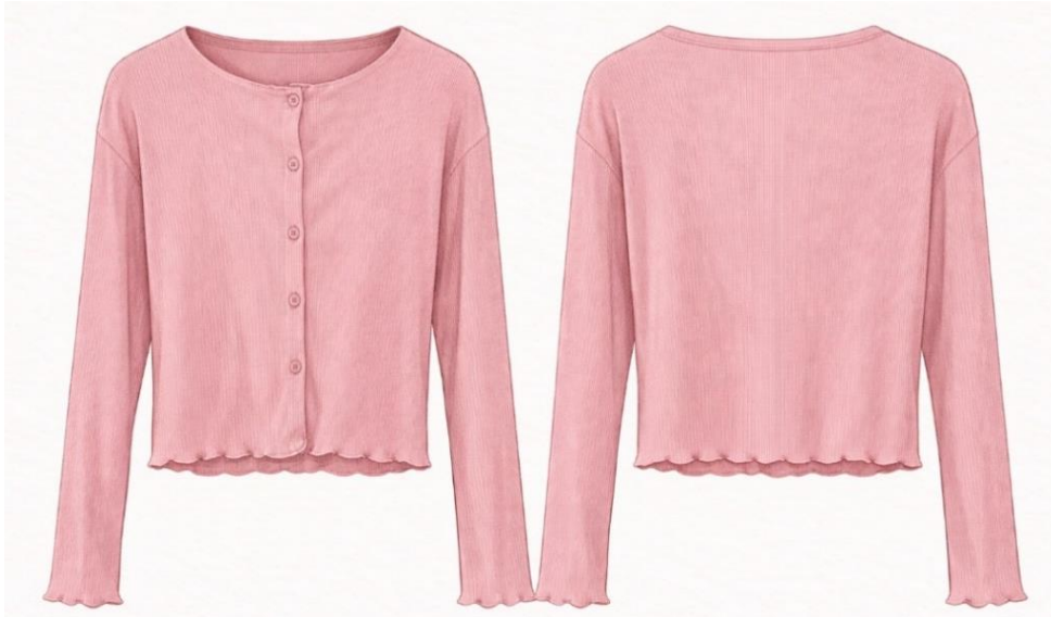
Gambar 2. 4 Produk NIRA: Blooming Cardigan

Cardigan rajut berwarna pink lembut dengan siluet cropped yang feminin dan modern. Didesain dengan bukaan kancing depan serta detail tepi bergelombang pada bagian bawah dan ujung lengan, memberikan sentuhan manis namun tetap minimalis. Tekstur rajut halus membuatnya nyaman dipakai untuk aktivitas sehari-hari maupun layering ringan.