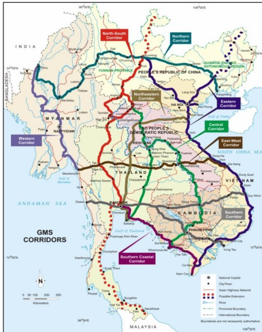
Gambar 2. 2 Peta Koridor Ekonomi Greater Mekong Subregion (GMS Corridors)