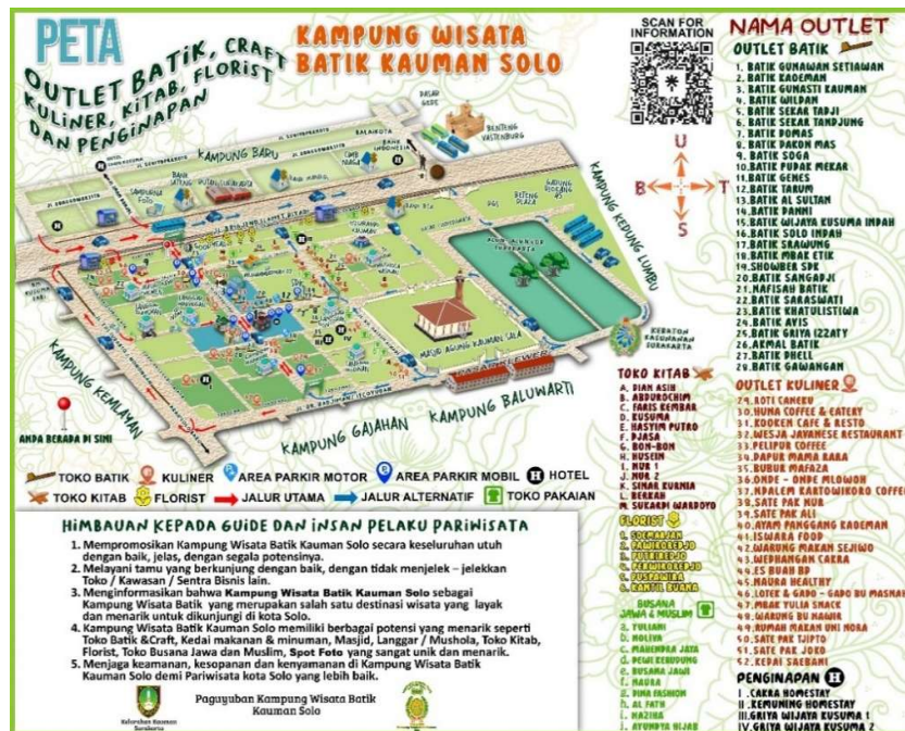
Gambar 2.3 Peta Wisata Kampung Batik Kauman