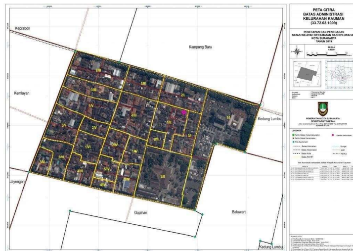
Gambar 2.1 Peta Batas Administrasi Kelurahan Kauman