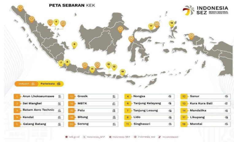
Gambar 1.1. Peta Sebaran Lokasi Kawasan Ekonomi Khusus di Indonesia