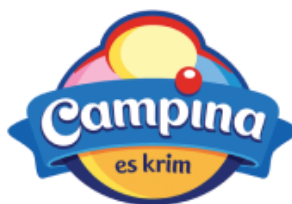
Gambar 2. 6. Logo PT Campina Ice Cream Industry Tbk