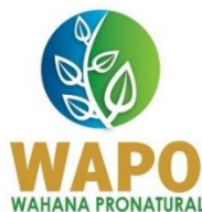
Gambar 2. 36. Logo PT Wahana Pronatural Tbk