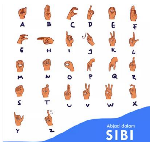
Gambar 2.1. Isyarat Abjad dalam SIBI